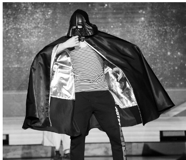
В соцсети «ВКонтакте» с 8 апреля 2021 года Многофункциональный культурный центр ТГУ проводил розыгрыш призов. На гала-концерте «Студенческая весна ТГУ – 2021» были объявлены имена семи победителей. Среди них студенты и сотрудники опорного вуза. Все они получили подарки с корпоративной символикой ТГУ.

– Оценивать номера участников было непросто. За моими плечами бурная студенческая внеучебная жизнь, и я понимаю, сколько сил вкладывают студенты в каждое выступление. Большое впечатление на меня произвели номера театрального и музыкального направлений. Несмотря на выбор сложных для исполнения произведений, у ребят всё получилось, – поделился член