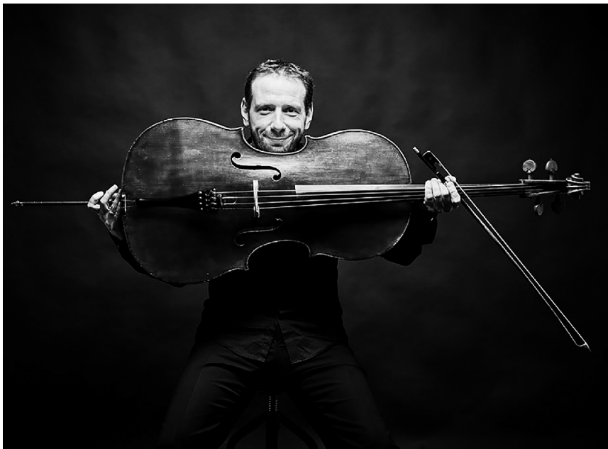
■ Виолончелист Борис Андрианов сыграет с симфоническим оркестром Тольяттинской филармонии

23 марта тольяттинские меломаны услышат виолончель блестящего российского музыканта, заслуженного артиста России Бориса Андрианова. Его концерт состоится в Тольяттинской филармонии в рамках программы Министерства культуры Российской Федерации «Всероссийские филармонические сезоны».