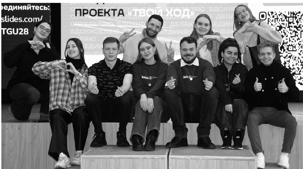
■ Студенты ТГУ готовятся заявить о себе в пятом сезоне проекта «Твой ход»

Студенчество — это не только учёба и сессии, но и время, когда можно пробовать, ошибаться и снова действовать, реализовывать проекты и осваивать новые роли. Именно такие возможности даёт федеральный проект «Твой ход», объединяющий в России более двух миллионов студентов.