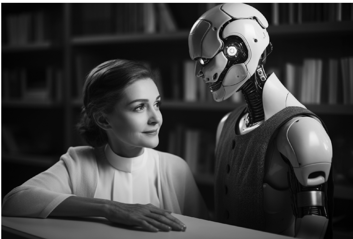
■ ИИ не заменит человеческого общения, но поможет психологам повысить качество психологической поддержки

М ожет ли чат-бот заменить консультацию психотерапевта? Какие технологии уже сейчас используются для анализа эмоций и поведения? Ответы на эти вопросы теперь ищут студенты магистратуры «Психология управления» Тольяттинского государственного университета (ТГУ) на новом курсе «Системы искусственного интеллекта в профессиональной деятельности психолога».