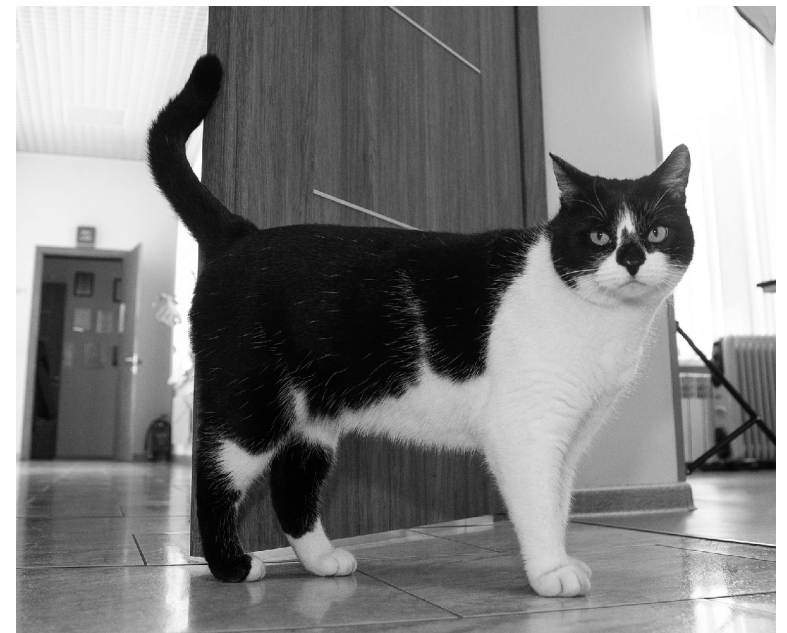
■ Кузьма проводит ежедневно аудит помещений главного корпуса ТГУ