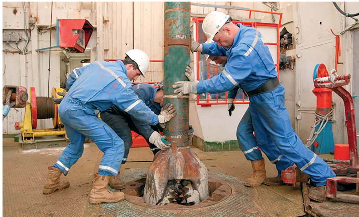
■ Технология плазменно-электролитического оксидирования, предложенная учёными ТГУ, является недорогим, технологичным и экологически чистым процессом

М одифицированная в Тольяттинском государственном университете технология плазменно-электролитического оксидирования (ПЭО) может оптимизировать добычу нефти и газа. Получены первые положительные результаты испытаний деталей для оборудования, используемого при бурении новых скважин.