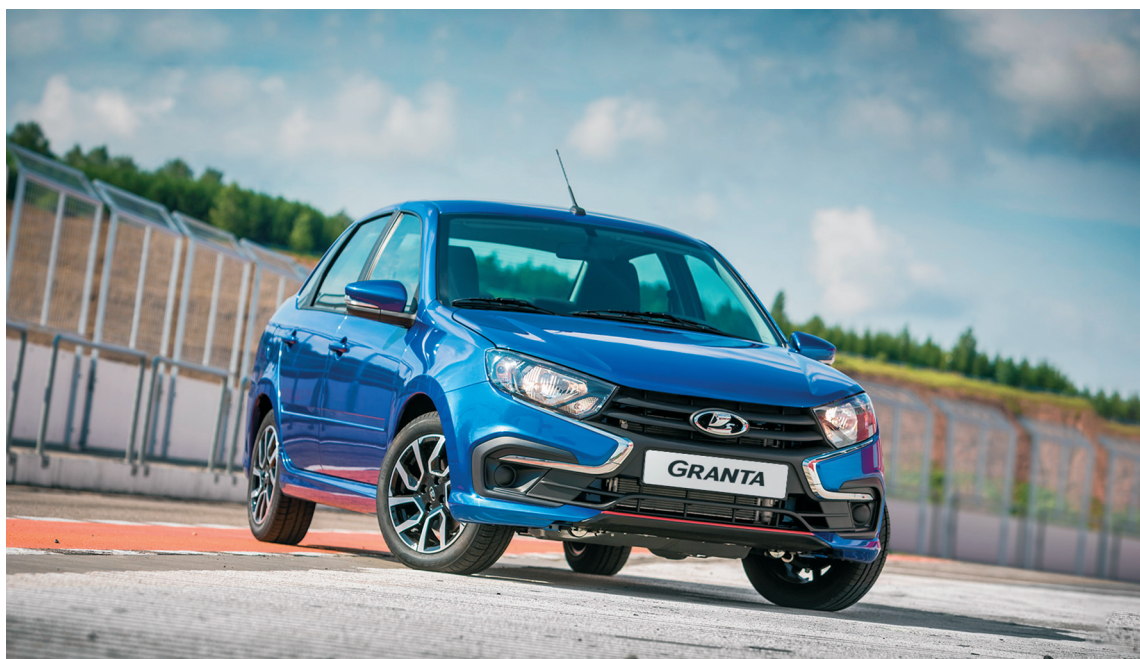
■ Проверять сборку двигателей автомобилей LADA будут с помощью оборудования, разработанного в ТГУ совместно с высокотехнологичным партнёром НПФ «АСК»

К онтролировать геометрические параметры блока цилиндров в автоматическом режиме при производстве двигателей автомобилей LADA будут на основе контрольно-управляющих систем, разработанных в Тольяттинском госуниверситете (ТГУ). Это позволит модернизировать зарубежную линию автоматического контроля и расширить её технологические возможности. Проект выполняется в рамках Передовой инженерной школы «Гибридные и комбинированные технологии» (ПИШ «ГибридТех») по заказу генерального партнёра ПИШ — АО «АВТОВАЗ».