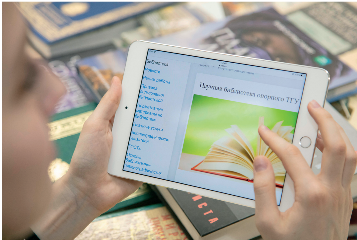
■ Благодаря «Сетевой электронной библиотеке» студенты и преподаватели ТГУ имеют доступ к научной литературе 24/7

Т ольяттинский государственный университет (ТГУ) – в числе постоянных и самых активных пользователей контента «Сетевой электронной библиотеки» (СЭБ). По итогам 2024 года вуз вошёл в топ-100 самых читающих вузов, заняв 20 позицию ранкинга.