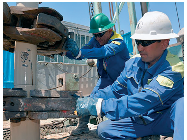
■ На смену чугуну и стали в нефтедобывающую промышленность придут изделия из растворимого магниевых сплавов, разработанного в ТГУ