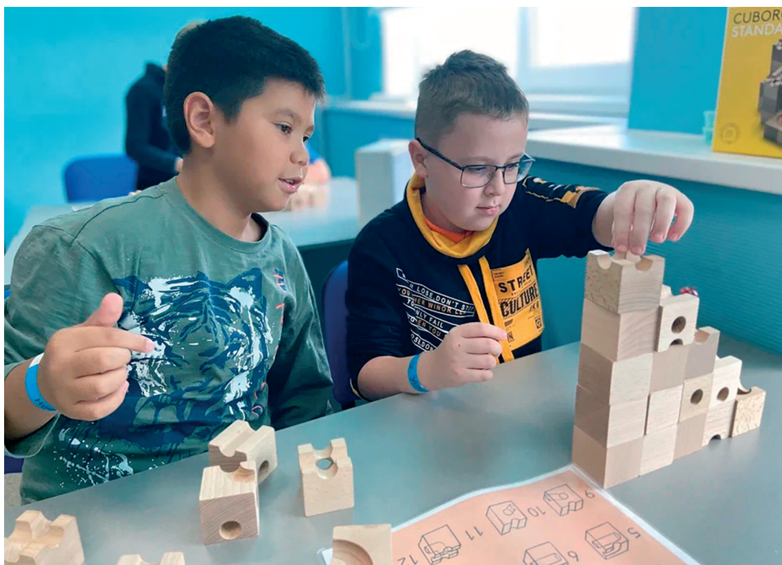
■ В Детском университете любой ребёнок — от годовалого малыша до подростка — может раскрыть свои таланты, способности и найти новых друзей

Путь в большую науку начинается с первых маленьких шагов. 10 лет назад в Тольятти открылось уникальное образовательное пространство — Детский университет «Эйнштейн». Сейчас это активно развивающийся проект Тольяттинского государственного университета (ТГУ). Здесь дети, начиная с трёх лет, узнают о науке и о том, как она влияет на нашу жизнь. Ребята постарше участвуют в профильных образовательных программах, а подросткам помогают выбрать будущую профессию.