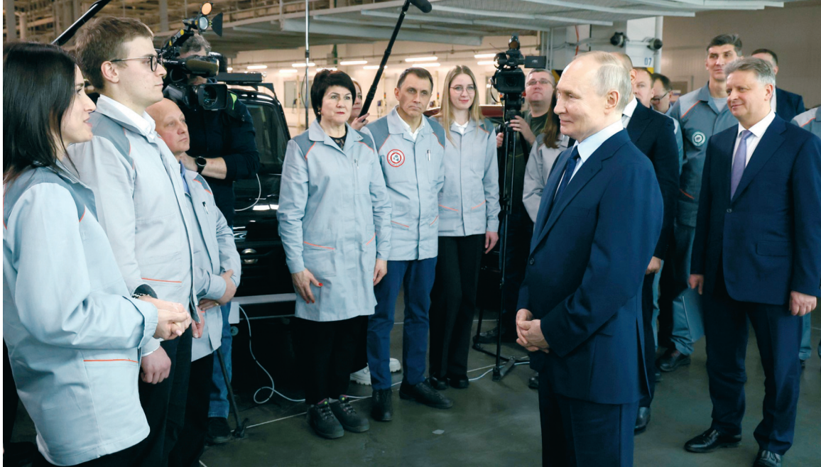
■ Сотрудники АО «АВТОВАЗ» в ходе общения с Владимиром Путиным задали вопрос о новом кампусе ТГУ