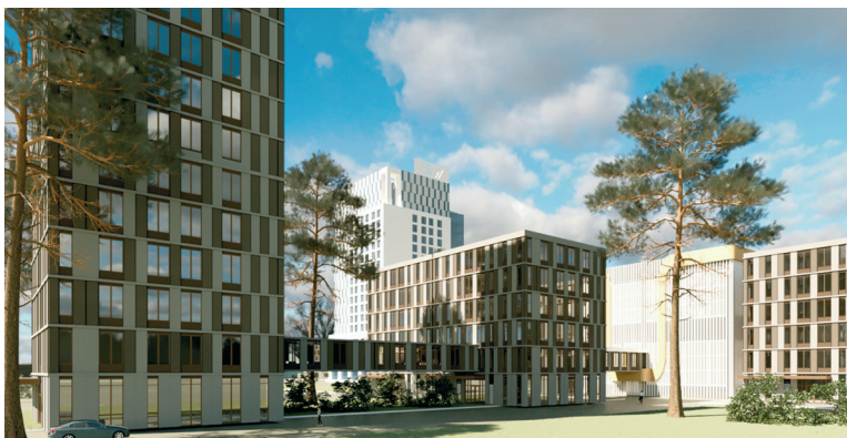
■ Каким будет новый кампус в Тольятти? Один из вариантов предлагают дизайнеры ТГУ

в Тольятти рекордно низкий уровень безработицы — 0,17%, есть высочайшая потребность в рабочих кадрах со стороны предприятий, которые активно развиваются. Это и АВТОВАЗ, и компании химической отрасли. В то же время появляется новый лидер создаваемой сейчас отрасли производства БАС — компания «Транспорт будущего», которой тоже нужны кадры. Поэтому