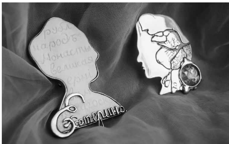
■ Созданная молодым ювелиром брошь «Великий» (справа) выставлялась в залах Новой Третьяковки в Москве

— Как получилось, что я пошла учиться на ювелира? Ещё в школе я планировала стать физиком, этот предмет мне безумно нравился. Но когда пришло время окончательного решения, родители предложили рассмотреть варианты творческих профессий. Из города я уезжать не хотела. Увидела для себя два интересных творческих направления подготовки в ТГУ: «Графический дизайн» и «Ювелирный дизайн». Ювелирный в итоге оказался ближе сердцу, наверное, потому, что у меня папа кузнец и я с самого детства в этом вариусь. Ювелиры, как и кузнецы, имеют дело с металлом, только меньшего размера. Со временем ювелирное дело меня увлекло, особенно когда что-то стало получаться. Но до сих пор для меня остаётся вопросом, буду ли я работать ювелиром. Бросать фотографию я точно не собираюсь в ближайшее время. Думаю, ничто не мешает заниматься параллельно тем и другим. Я уже многое успела попробовать, а хочу ещё больше.