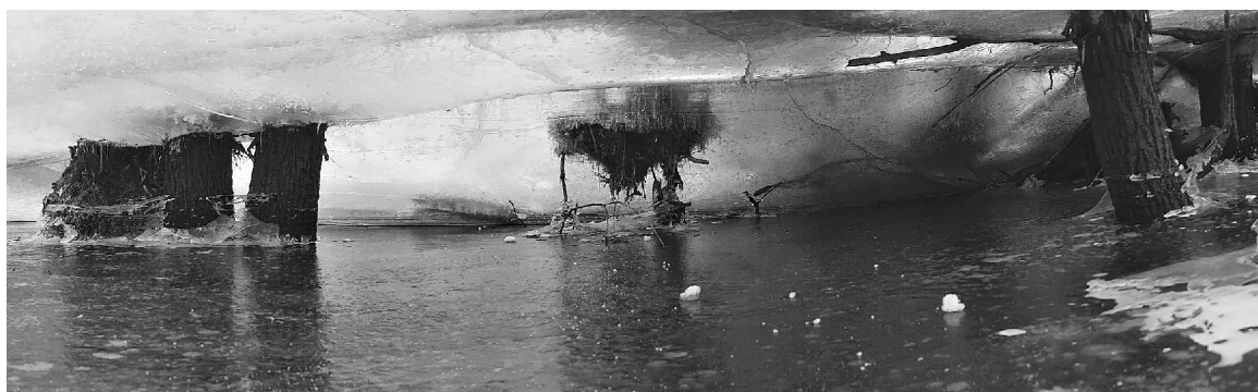
■ Фотографию «Там, где нас нет» студентка ТГУ сделала, погрузившись в ледовый плен

Чтобы получить удачный снимок, порой приходится сделать не одну сотню кадров. В разных местах солнечный свет падает по-разному, так что ты всё время нахо-