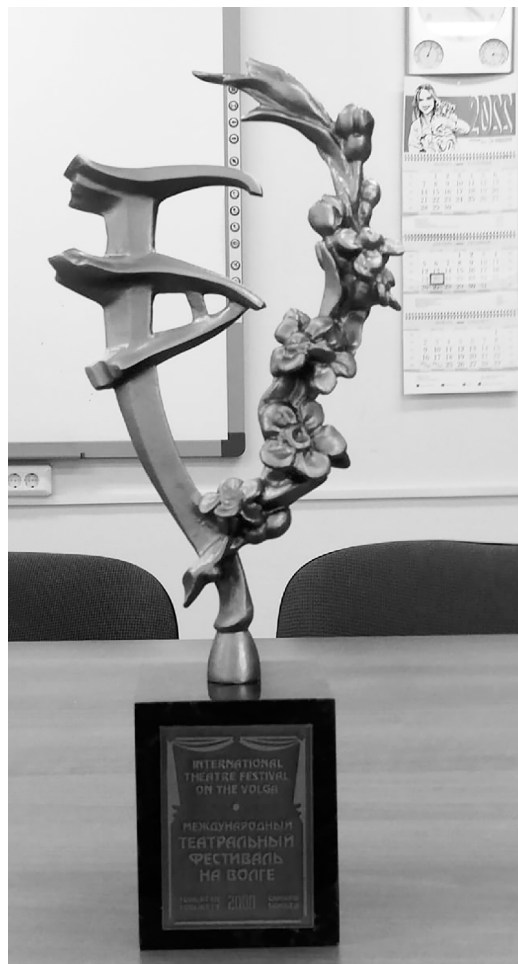
■ Копию статуэтки ТГУ сделал по секретной технологии

Т ольяттинский госуниверситет (ТГУ) сделал для городского краеведческого музея копию наградной статуэтки Глеба Дроздова. Она стала экспонатом выставки «20 век: Ставрополь-Тольятти».