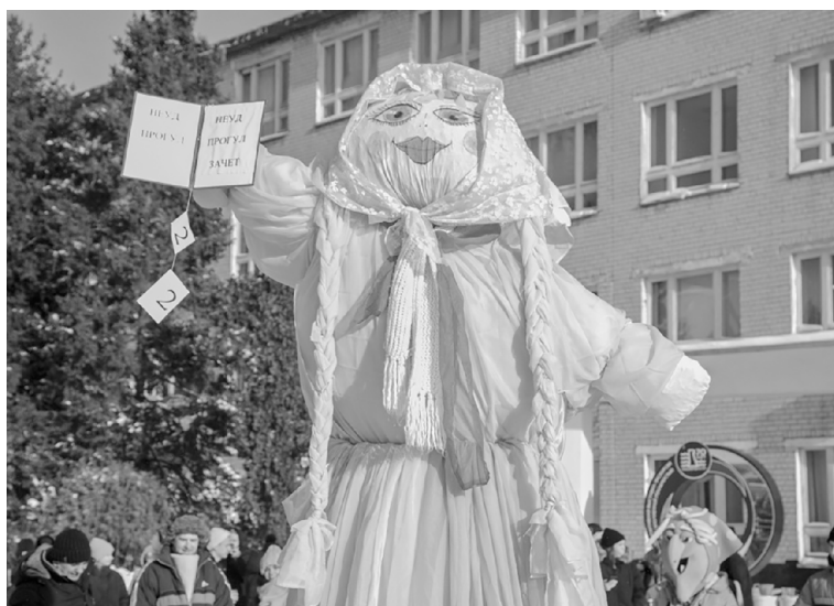
■ Конец сессии в ТГУ отмечают большим костром, в котором горят Сессия и все студенческие «хвосты»

С туденты по всему миру – народ особый, весёлый, любознательный и иногда суеверный. В каждом университете свои традиции и свои приметы. Специально к Татьянинному дню, который отмечается 25 января, корреспонденты Молодёжного медиахолдинга «Есть talk!» Тольяттинского госуниверситета и газеты «Тольяттинский университет» собрали любопытную информацию о некоторых таких суевериях и обычаях.