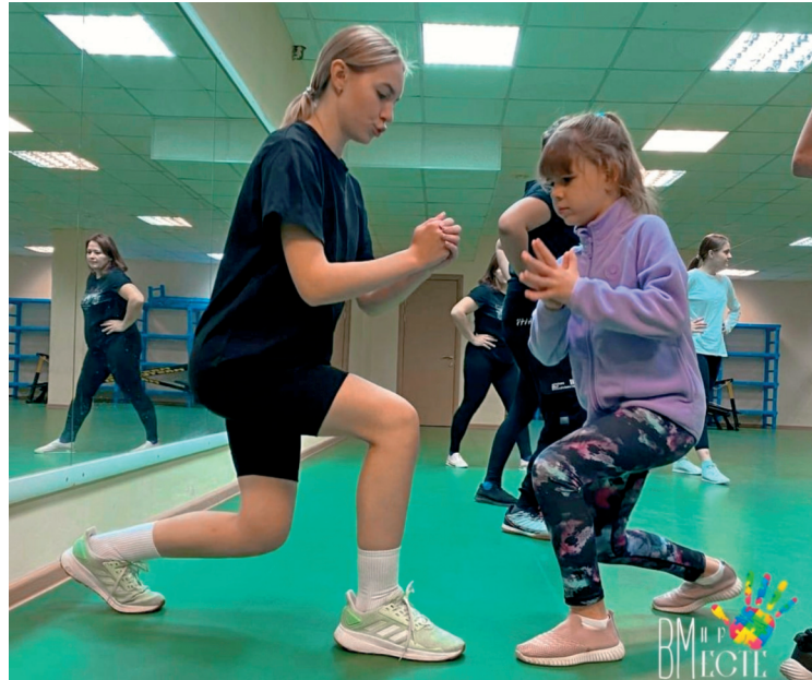
■ Основа подхода – групповые занятия

В ТГУ работает уникальный социальный проект «В мир вместе»