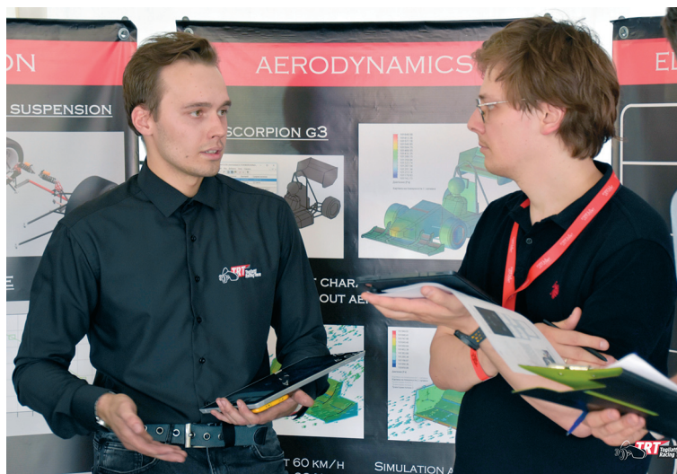
■ Каждый член команды Togliatti Racing Team должен быть готов к диалогу на английском языке