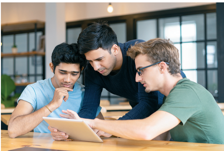
■ Студенты из Индии первыми поступят в университет нового поколения

Т ольяттинский государственный университет (ТГУ) получил международное свидетельство на товарный знак NewGenUniv. Под этим брендом ТГУ выводит на англоязычный образовательный рынок запатентованную систему высшего образования онлайн, реализуемую в русскоязычном секторе под брендом «Росдистант».