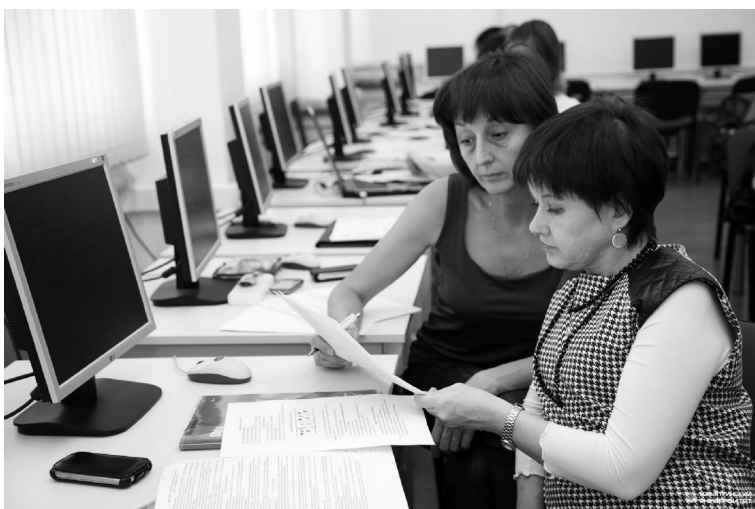
■ Слушатели курсов смогут получить новую профессию или развить уже имеющиеся навыки

В качестве регионального оператора федерального проекта «Содействие занятости» Тольяттинский госуниверситет (ТГУ) обучит жителей Самарской области по семи образовательным программам. Бесплатное обучение могут пройти люди, относящиеся к социально уязвимым группам населения, а также безработные.