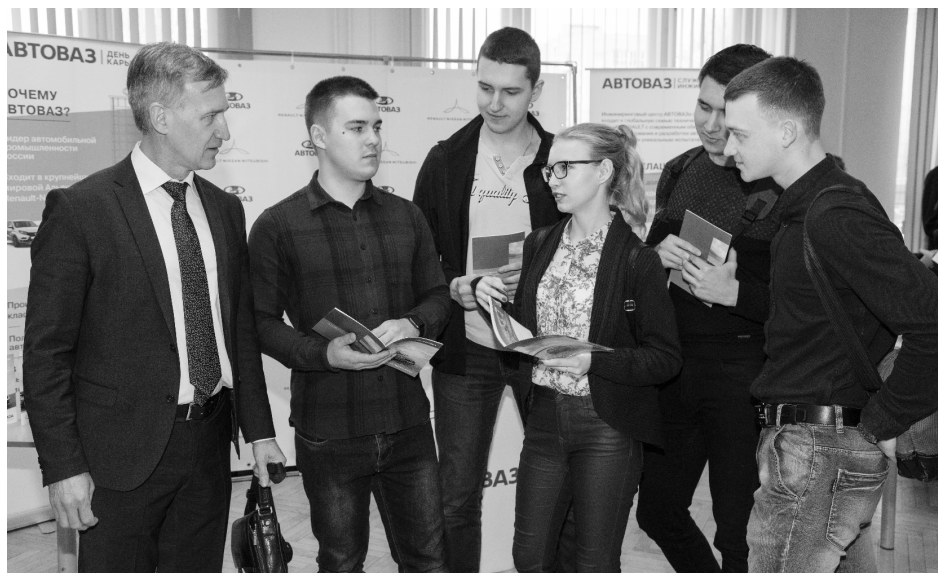
■ Работодатели и студенты присмотрятся друг к другу на встрече в ТГУ

вуза. Каждый сможет посетить и карьерную выставку от ведущих работодателей Самарской области, в числе которых АО «АВТОВАЗ», ПАО «Тольяттиазот», ПАО «КуйбышевАзот», ООО «Тольяттикаучук», фармацевтическая компания «Озон», Волжский светотехнический завод «Луч», ООО «Тольяттинский Трансформатор», ГУ МЧС по Самарской области.