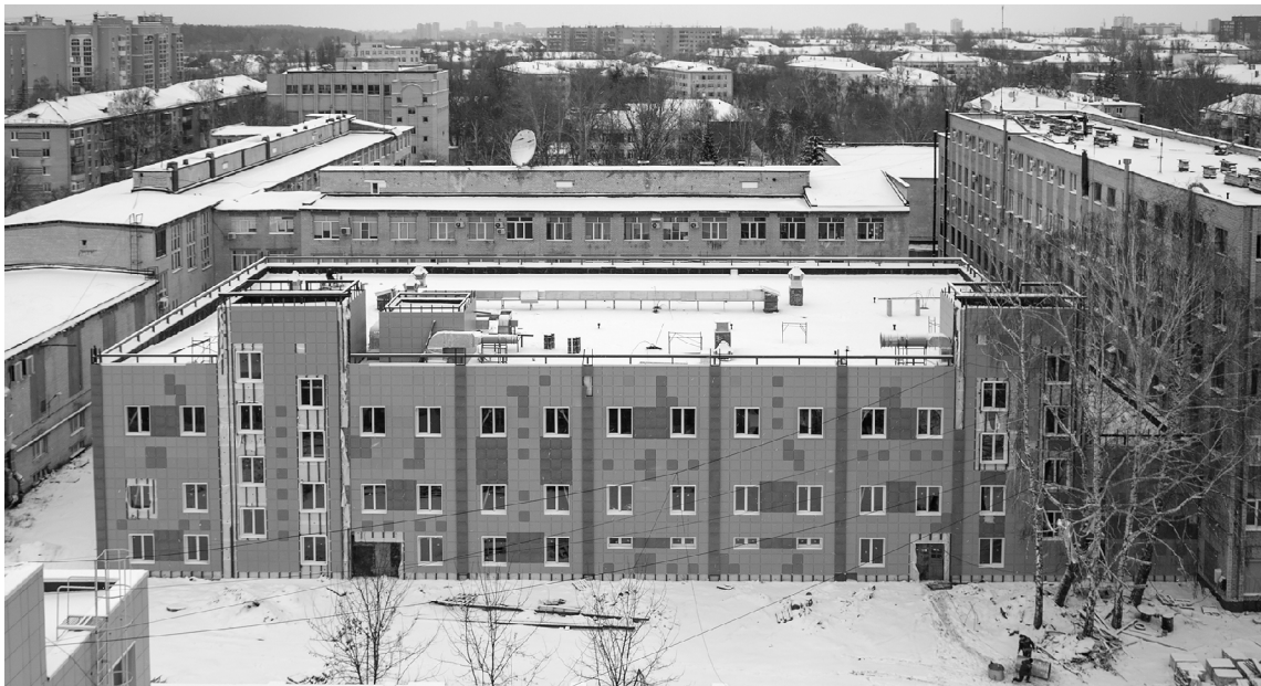
■ Инновационно-технологический парк ТГУ готовят к открытию в 2023 году

Т ольяттинский государственный университет (ТГУ) готовит к запуску опытное производство линейки ультразвуковых комплексов и инструментов для медицинской и автомобильной промышленности.