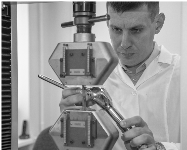
■ Благодаря разработкам учёных ТГУ эндопротезирование станет менее травматичным

— Удаление костного цемента — серьёзная проблема для медиков. Решающий эту проблему ультразвуковой ап-