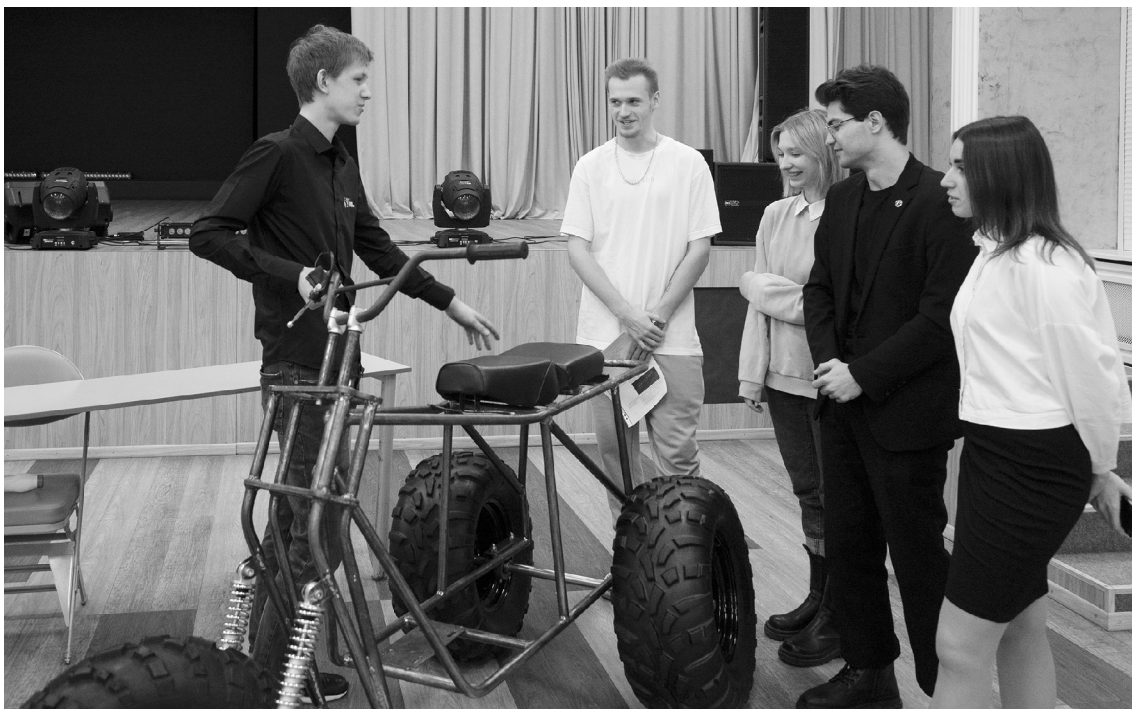
■ «Трайк для бездорожья» – это готовое для выхода на рынок транспортное средство, созданное командой проекта «Конструкторское бюро»

О коло 1000 студентов Тольяттинского государственного университета (ТГУ) и Тольяттинской академии управления (ТАУ) стали участниками большого проектного марафона – акселерационной программы Startup Doing. Молодые предприниматели и изобретатели разрабатывали свои проектные инициативы с перспективой их реализации и внедрения в систему «Умный город».