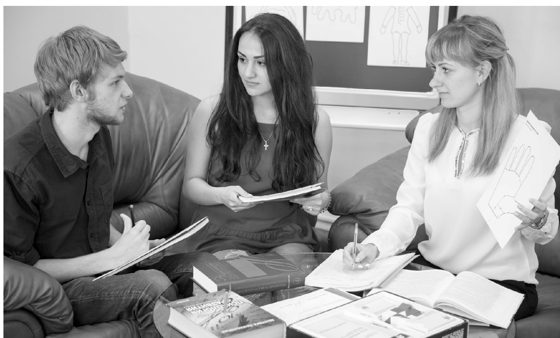
■ С поддержкой группы проще преодолевать проблемы

Подобная психотерапевтическая группа формируется в вузе впервые. Занятия организует научно-исследовательская лаборатория «Центр психологических исследований и консалтинга ТГУ», действующая на базе кафедры «Педагогика и психология» гуманитарно-педагогического