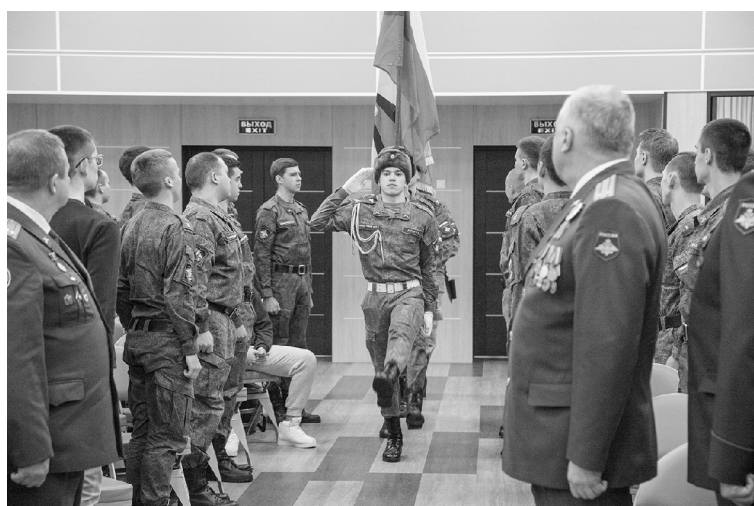
■ За 60 лет военный учебный центр ТГУ подготовил 17 тысяч артиллеристов

— Среди всех памятных дат, которые отмечают в России как дни родов войск и видов Вооружённых сил, День ракетных войск и артиллерии занимает особое место. Он был установлен Указом Президиума Верховного Совета СССР ещё в военное время — 21 октября 1944 года. И дату 19 ноября