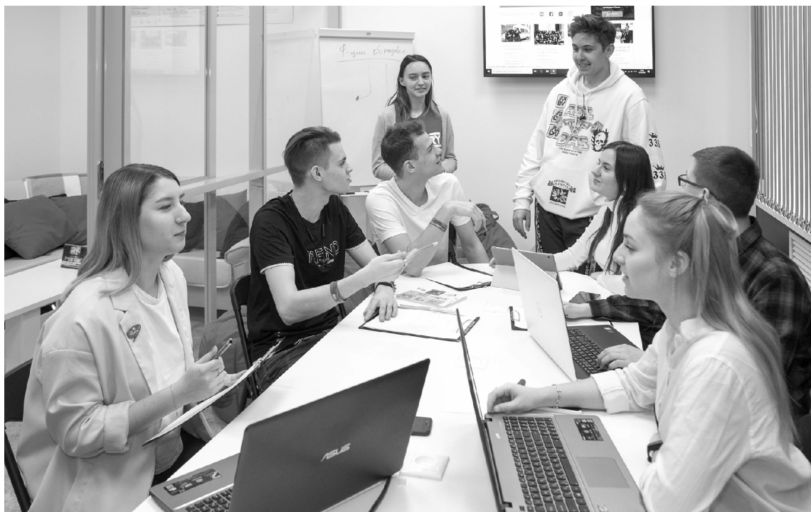
Цифровой след поможет лучше понять запросы студентов

У чёные Тольяттинского государственного университета (ТГУ) участвуют в комплексном научно-исследовательском проекте по улучшению качества онлайн-обучения. В основе — исследования, которые специалисты ТГУ в сотрудничестве с Университетским консорциумом исследователей больших данных провели в социальных сетях, используя инструменты анализа больших данных (Big Data). Именно с их помощью, уверены эксперты, можно сделать большой шаг к персонализированному обучению.