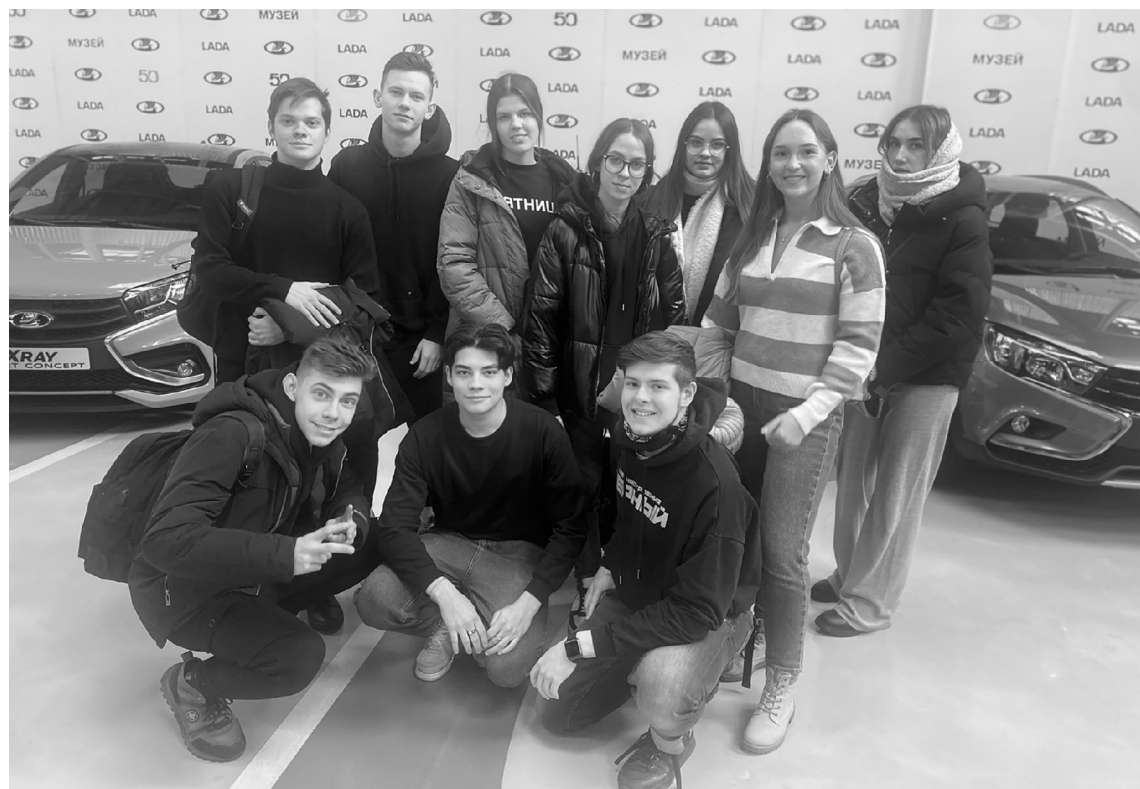
■ «LADA рулит»: в музее АВТОВАЗа студентам ТГУ, СамГТУ и СНИУ им. Королёва рассказали историю автомобильного бренда

С тудентов Тольяттинского государственного университета (ТГУ) пригласили стать частью команды АВТОВАЗа. Первое знакомство с потенциальным работодателем состоялось 16 ноября в Университете Группы «АВТОВАЗ»: студенты посетили музей предприятия, приняли участие в интеллектуальной игре «Ворошиловский стрелок» и пообщались с молодыми специалистами автозавода.