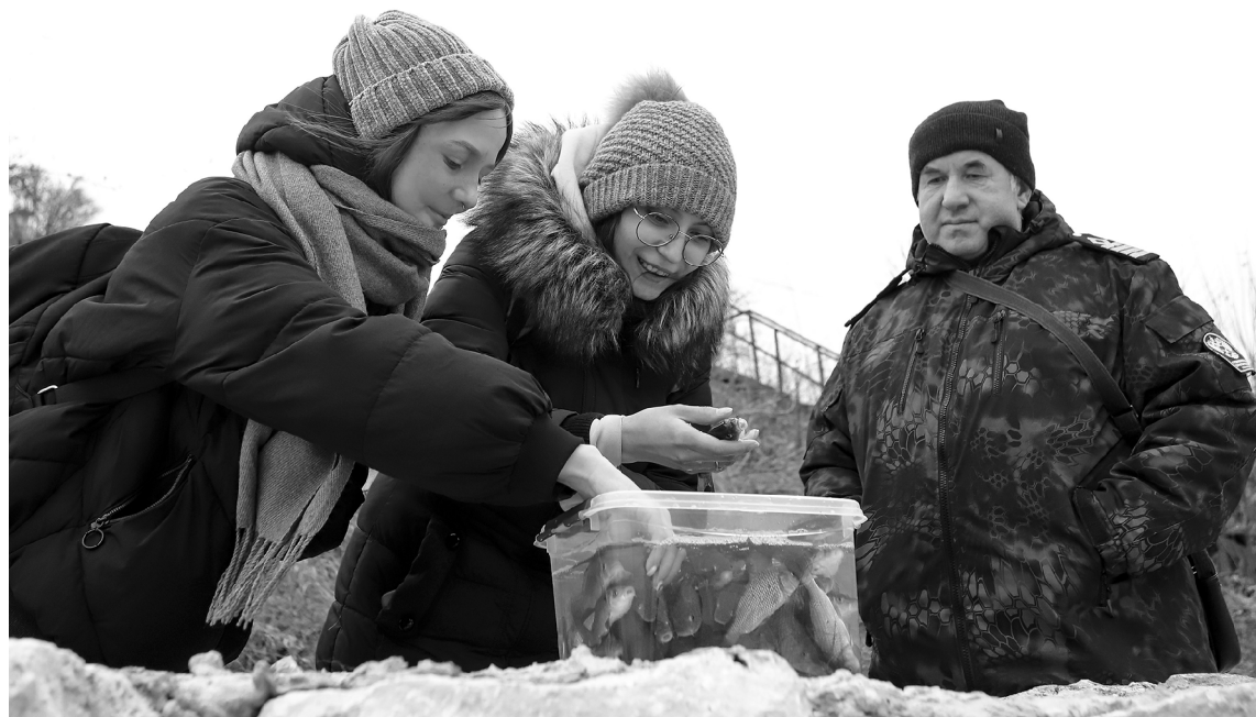
■ Студенты ТГУ помогли малькам отправиться в свободное плавание

П опуляция ценной рыбы в Волге пополнилась на 12 тысяч мальков сазана. «Тольяттиазот» провёл очередную экологическую акцию по восстановлению биоресурсов реки. Впервые участие в ней приняли студенты Тольяттинского госуниверситета (ТГУ).