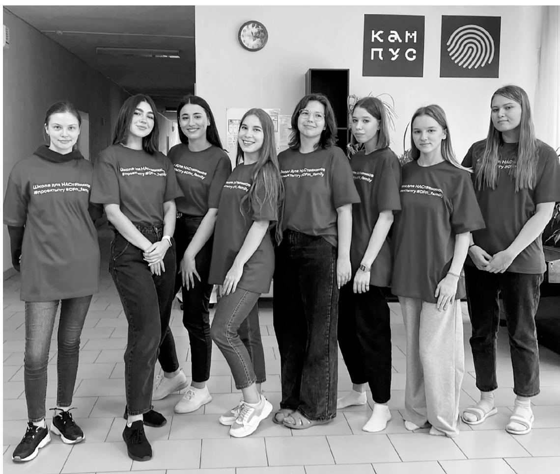
■ Студенты-наставники из ТГУ не только учат, но и сами учатся с удовольствием

Г отовить педагогов под ключ в Тольятти начнут со школы. Тольяттинский государственный университет (ТГУ) запустил проект «Школа для НАСтавников». Он объединил студентов вуза и учеников профильных педагогических классов для разработки актуальных для образовательной сферы инициатив и прокачки soft-skills будущих педагогов. По словам авторов, проект будет мотивировать абитуриентов выбирать педагогические и гуманитарные направления подготовки при поступлении в ТГУ.