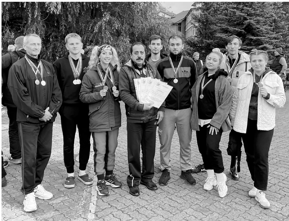
■ Команда ТГУ нацелилась на призовые места в следующей профсоюзной спартакиаде

Команда Тольяттинского государственного университета (ТГУ) успешно выступила на XXII Областной профсоюзной спартакиаде работников народного образования и науки РФ. Тольяттинцы заняли четвертое место в общекомандном зачёте среди 17 профсоюзов учреждений высшего и среднего профессионального образования Самарской области.