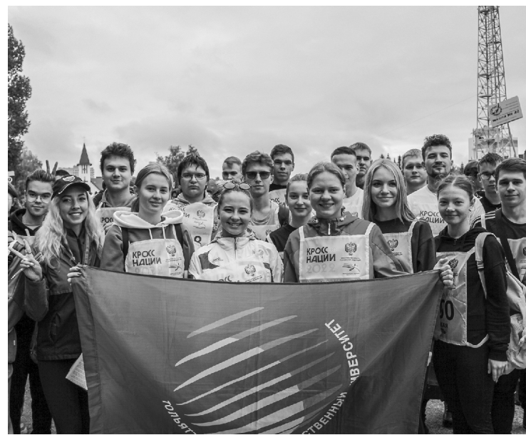
■ «Кросс нации» — это ЗОЖно и весело

«Кросс нации» впервые состоялся в 2004 году. Сегодня он является самым массовым легкоатлетическим забегом в России, участие в котором принимают сотни тысяч человек. Ежегодно акция проходит в десятках российских городов.