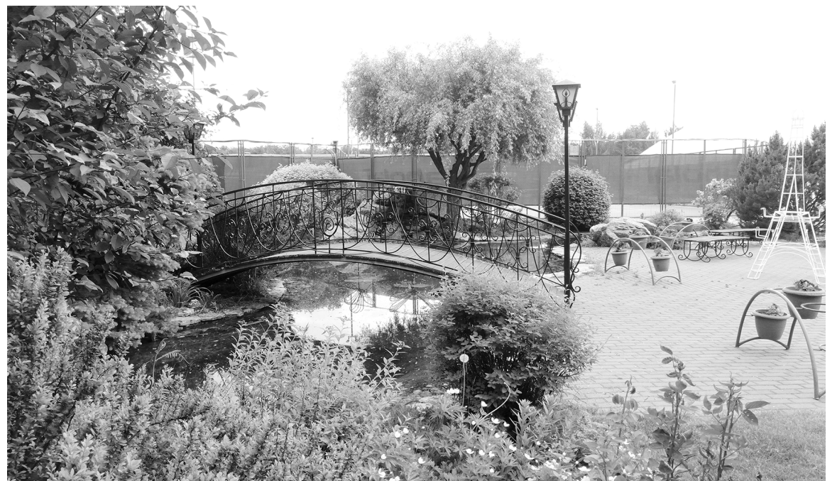
■ Центр дизайна ТГУ начинает проектировать сад, который поможет пациентам быстрее выздороветь