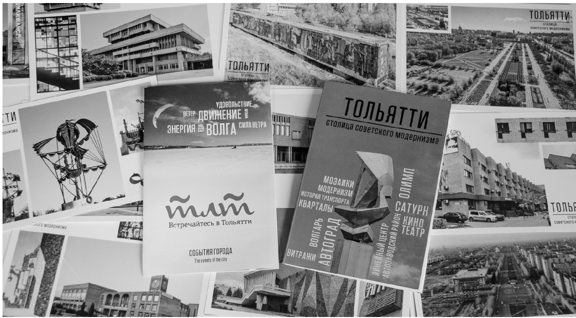
■ Путеводитель от центра урбанистики ТГУ «проведёт» туриста по главным достопримечательностям советского модернизма

П утеводитель «Тольятти – столица советского модернизма», недавно созданный в Тольяттинском государственном университете (ТГУ), уже «ездит» по туристическим выставкам. Он предлагает посмотреть новым взглядом на город, известный на всю страну как центр автопрома.