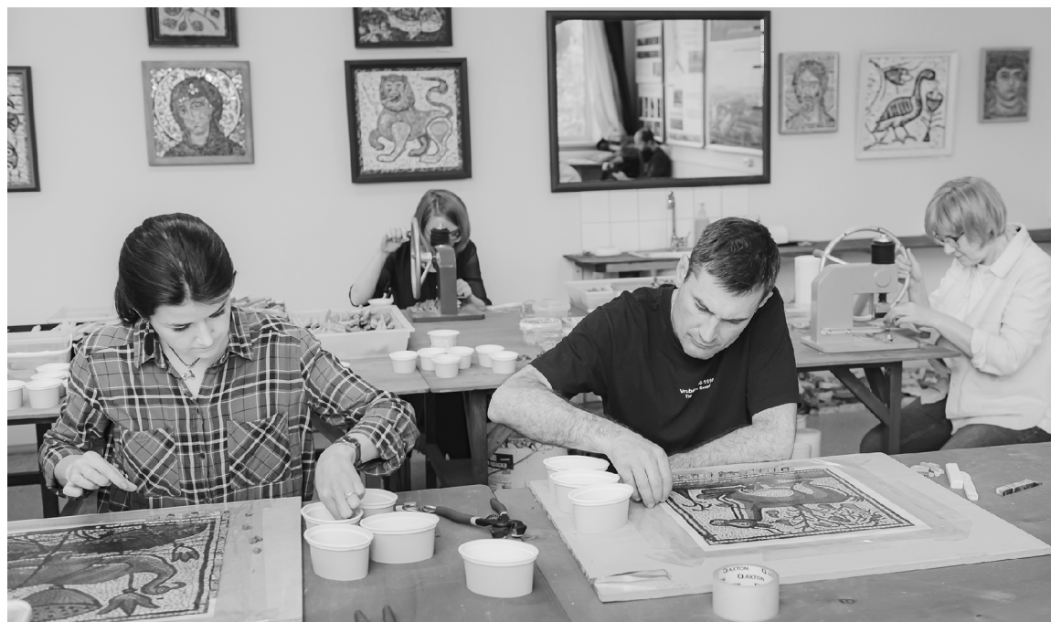
■ Процесс выкладывания мозаики похож одновременно на медитацию и психотерапию...

— Первый раз увидела, как собирают мозаику, когда работала в мастерской, где занимались в основном храмовыми видами искусства. Там была девочка, которая выкладывала мозаичный пол из мрамора для храма. Это была огромная звезда с лучами, на столах у нас лежали её сегменты, очень большие. Я помню, что мне очень хотелось подойти и выложить хоть немножечко, но меня