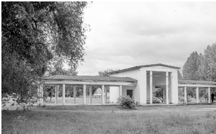
■ Сакральную для тольяттинцев территорию парка Центрального района благоустроят по проекту, разработанному специалистами Тольяттинского госуниверситета

В 2023 году начнётся долгожданная реновация территории парка Центрального района Тольятти. Средства на первый этап благоустройства будут выделены в рамках федеральной программы «Формирование комфортной городской среды». Проект реновации уже разработан специалистами Тольяттинского госуниверситета.