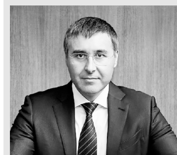
Валерий ФАЛЬКОВ, министр науки и высшего образования РФ:

строения и смежных отраслей через опережающие разработки, реинжиниринг и интегрированную с реальными проектами систему