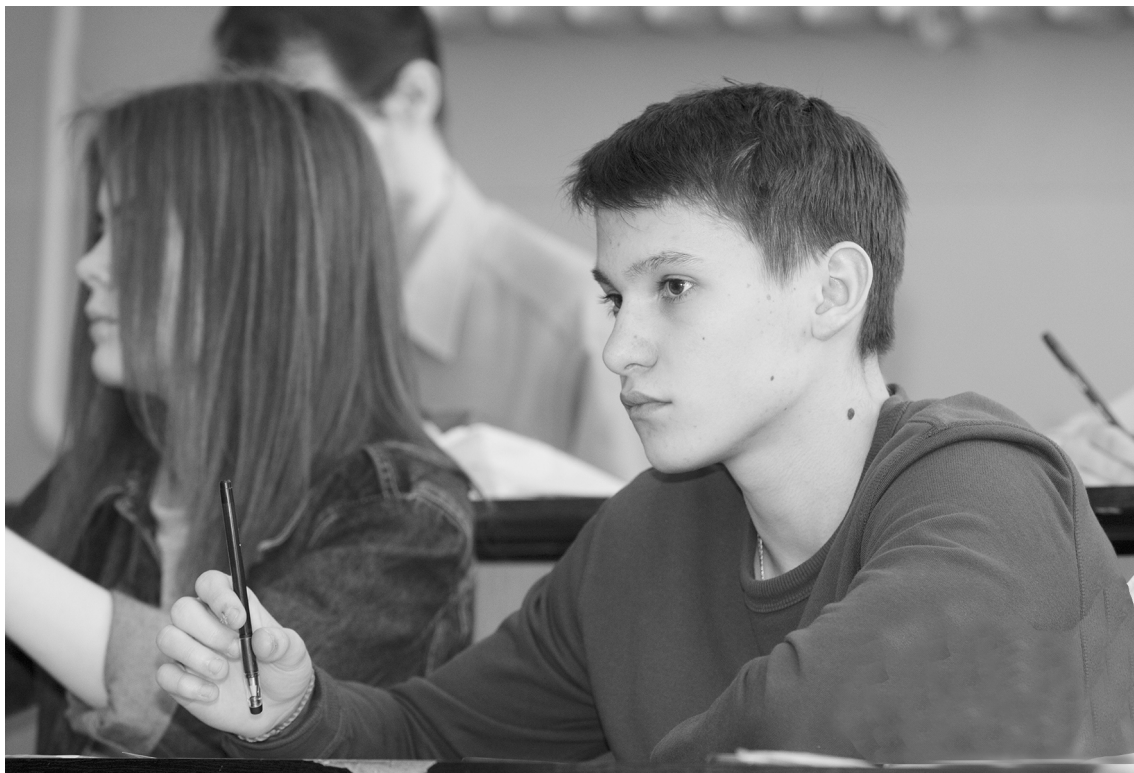
■ В ТГУ подготовка ведётся по приоритетным для научно-технологического развития России направлениям, связанным с изучением математики, химии, информационных технологий, строительства

В Тольяттинском государственном университете стартовала приёмная кампания — 2022