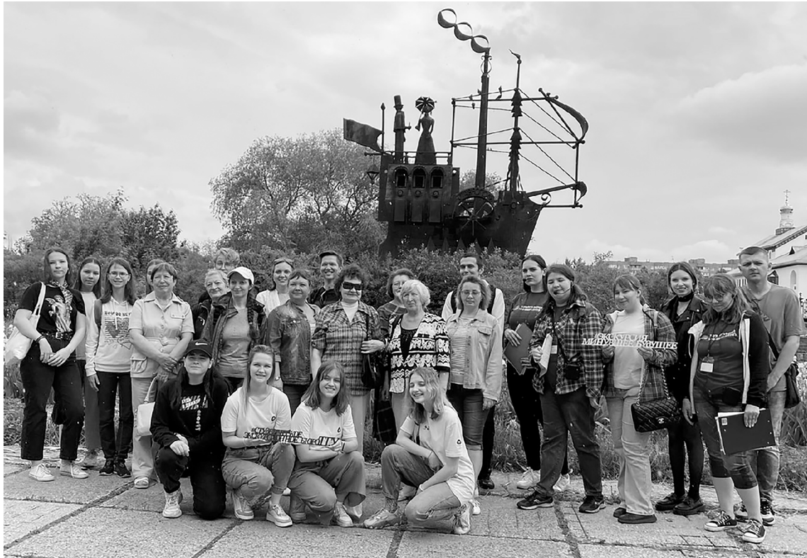
■ Студенты ТГУ рассказали тольяттинцам об «Истории транспорта»

О прошлом, настоящем и будущем Тольятти, знаковых местах и самых интересных достопримечательностях города узнали участники экскурсии «Минувшее будущее». Её провели студенты кафедры «История и философия» Тольяттинского государственного университета (ТГУ) в рамках городского проекта «285 шагов по Тольятти», приуроченного к 285-летию города.