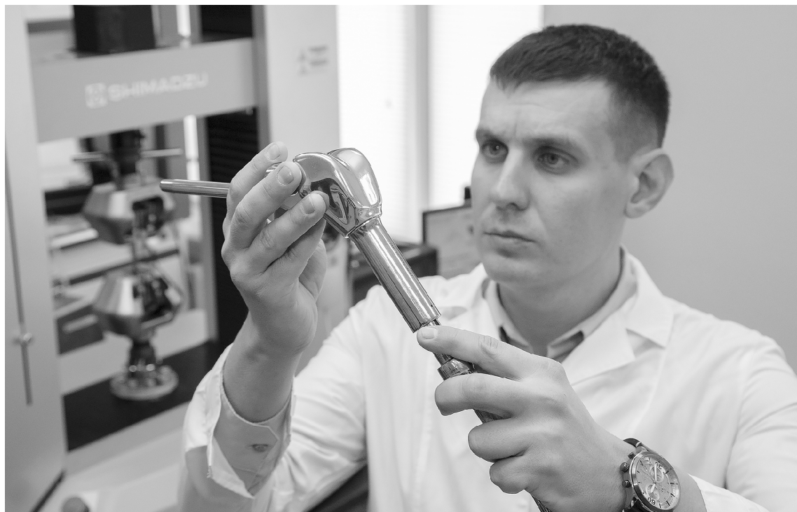
■ Разработка ТГУ и партнёров вуза позволяет продвинуться в решении задач по достижению технологического суверенитета России в медицинской сфере

У чёные Самарской области обеспечат импортозамещение медицинских технологий и изделий. Тольяттинский госуниверситет (ТГУ) запатентовал подвижной механизм детского эндопротеза, который может использоваться в лечении маленьких пациентов с онкологическими заболеваниями. Отечественная разработка в производстве значительно дешевле, но при этом не уступает по качеству зарубежному аналогу.