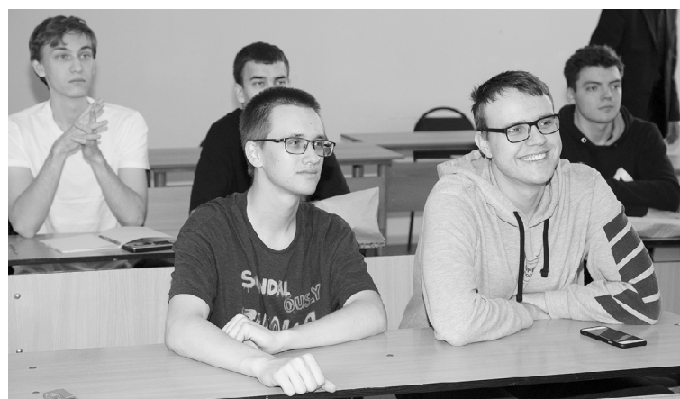
■ Некоторые из студентов-энергетиков Тольяттинского госуниверситета свяжут своё будущее с ТОАЗом

как правило, берём студентов со 2-го курса — к этому времени уже можно оценить уровень их успеваемости и вовлечённости в проектную деятельность. Если студент учится на хорошо и отлично, ТОАЗ выплачивает ему стипендию раз в семестр. А сразу по окончании вуза ему гарантируется трудоустройство.