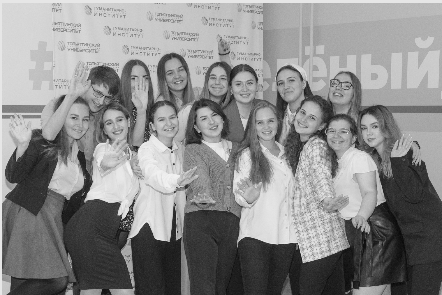
■ Будущие педагоги – выпускники кафедры «Педагогика и методики преподавания» ТГУ 2022 года

Т ольяттинский государственный университет (ТГУ) стал участником трёхстороннего соглашения по популяризации социально-педагогических профессий. Кроме ТГУ документ подписали Министерство образования и науки Самарской области и Самарская областная организация Профсоюза работников народного образования и науки Российской Федерации.