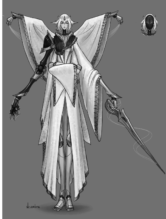
■ Сфантазированный механид Танта может стать героем нового комикса студента ТГУ