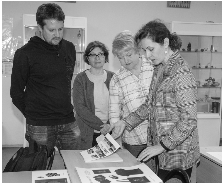
■ Членов жюри впечатлил креатив участников конкурса