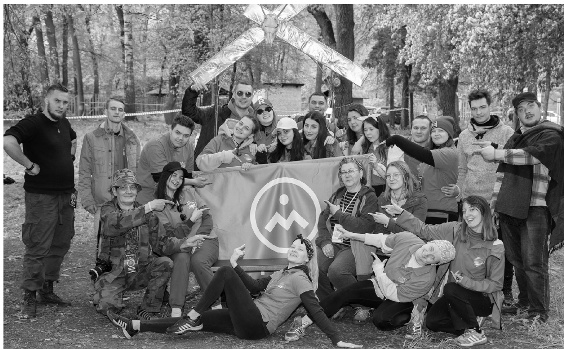
■ Участников турслёта ТГУ не испугал холодный май

«Хоть и холодно, да не голодно», — пожалуй, под таким девизом состоялся в этом году 19-й традиционный туристский слёт Тольяттинского государственного университета (ТГУ). С 20 по 22 мая более 60 студентов и выпускников вуза, махнув рукой на морозящий дождь и необычно низкую для конца весны температуру, собрались на уже привычном месте — в посёлке Фёдоровка на базе отдыха «Лесобон».