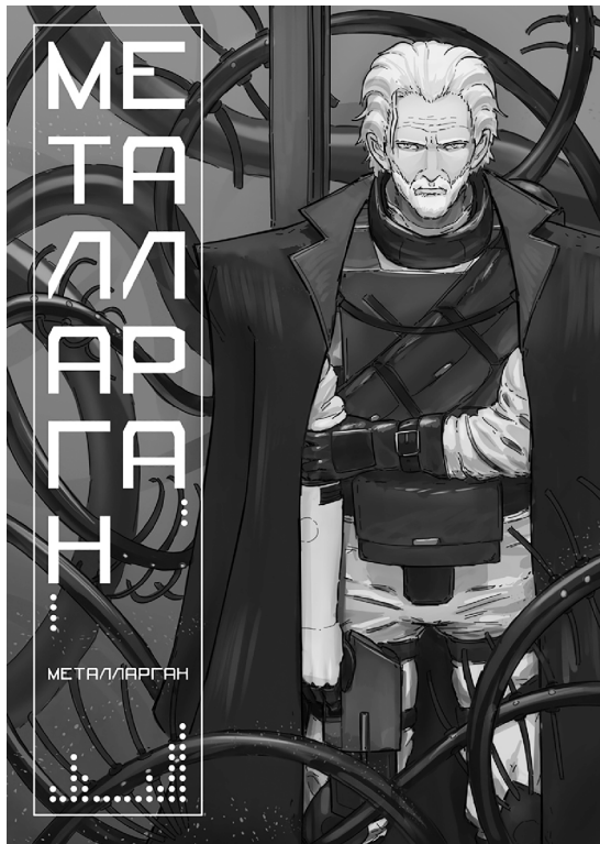
■ На создание первой главы манги у художника ушло полгода

Помимо «Металларгана», у меня недавно появился второй сеттинг, в центре которого – механиды, гуманоидная форма жизни, основанная на симбиозе органики и металлов. Пока это просто персонажи. Я создаю их как референсы – иллюстрации, где персонаж прорисовывается максимально подробно, чтобы в будущем, когда дело дойдёт до создания комикса, его было проще рисовать в разных ситуациях. В основе каждого механида – какой-то земной металл или вымышленный его аналог. Способности персонажей будут завязаны на свойствах этих металлов. На них также основаны и имена персонажей: Аура, Аргента, Ферро, Танта, Плам, Никель. Я не планирую забрасывать «Металларган», но этот сеттинг мне тоже интересен. Допускаю, что он может перерасти во второй комикс.