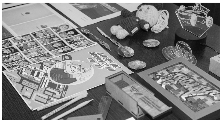
■ Некоторые из сувениров отправятся в магазин корпоративной продукции ТГУ.STORE