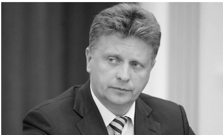
■ Новый президент АВТОВАЗа Максим Соколов имеет продолжительный опыт управления транспортной отраслью

АО «АВТОВАЗ» возглавил бывший министр транспорта РФ и экс-вице-губернатор Санкт-Петербурга Максим Соколов. Такое решение принял совет директоров автоконцерна. Тольяттинский государственный университет (ТГУ) является основным стратегическим партнёром АО «АВТОВАЗ» в подготовке молодых квалифицированных профессионалов для разработки и внедрения новых конструкторско-технологических решений.