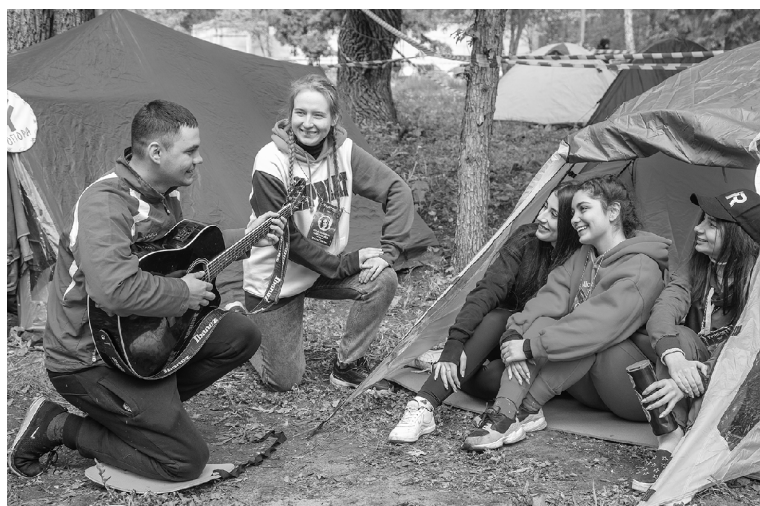
■ «Милая моя, солнышко лесное, где, в каких краях встретишься со мною?»

«Хоть и холодно, да не голодно», — пожалуй, под таким девизом состоялся в этом году 19-й традиционный туристский слёт Тольяттинского государственного университета (ТГУ). С 20 по 22 мая более 60 студентов и выпускников вуза, махнув рукой на морозящий дождь и необычно низкую для конца весны температуру, собрались на уже привычном месте — в посёлке Фёдоровка на базе отдыха «Лесобон».