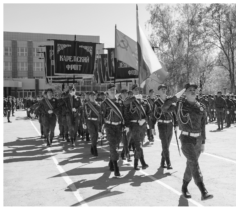
■ Более 600 курсантов военного учебного центра прошли парадным маршем перед главным корпусом ТГУ

Война коснулась каждой российской семьи, и воспоминания о событиях 1941—1945 годов должны сохраниться в нашей памяти и в памяти будущих поколений. Поэтому одним из самых трогательных моментов дня стала акция «Наш Бессмертный полк». Преподаватели,