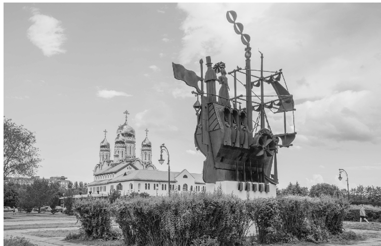
■ Урбанисты ТГУ помогут Тольятти обрести Линейный центр

Два представителя Тольяттинского госуниверситета стали финалистами Всероссийского конкурса «Моя страна – моя Россия». Они успешно прошли жёсткий этап заочных экспертиз, на котором отсеялось 99 % проектов. На этой неделе начинается этап очных защит.