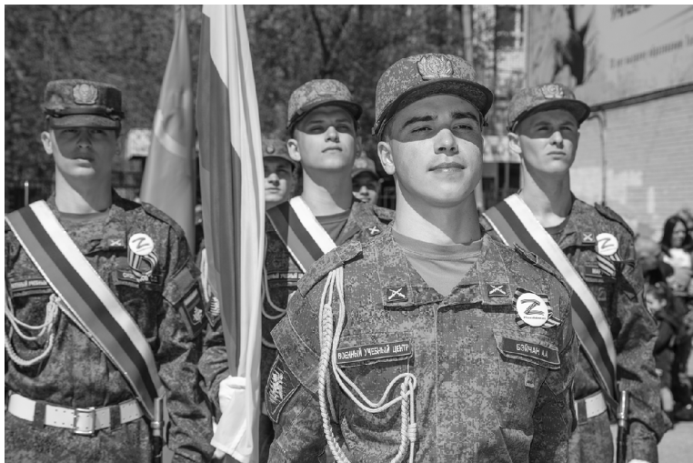
■ Военный учебный центр ТГУ отметил в апреле 2022 года 55-летие

Тольяттинский госуниверситет — единственный гражданский вуз Поволжья, который ежегодно проводит собственный военный парад. Торжественные мероприятия в честь Дня Победы в вузе организованы масштабно. Это позволяет помнить подвиги отцов, дедов и прадедов, сражавшихся против фашизма на фронтах Великой Отечественной войны, отстаивавших независимость своей страны.