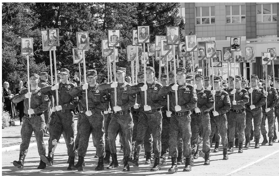
■ «Наш Бессмертный полк» – самая мощная и эмоциональная часть парада в ТГУ