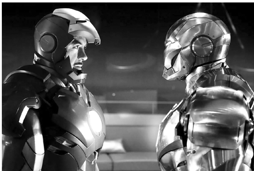
■ Разработчикам экзоскелета из ТГУ не дают покоя лавры Железного человека. На фото – кадр из фильма «Железный человек 2» (2010 г., реж. Джон Фавро, 12+)