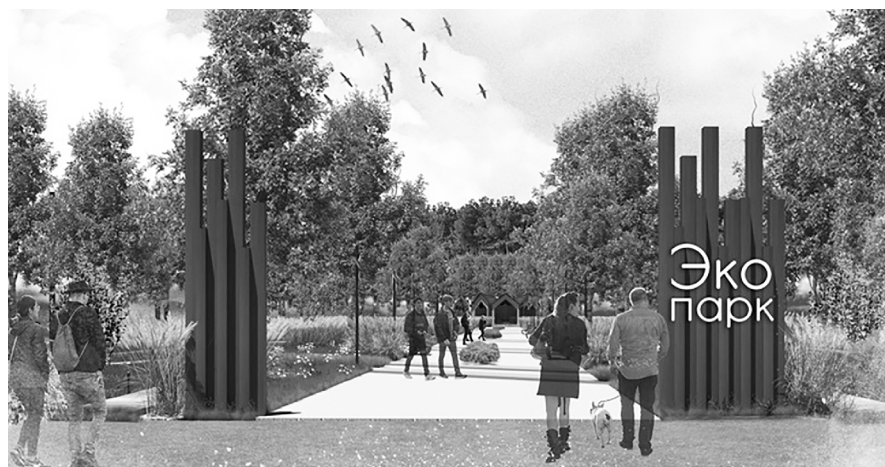
■ Экопарк в тольяттинском микрорайоне Шлюзовой станет местом для отдыха и проведения культурных событий

В будущем «Эко-Парке Шлюзовой» стартовали работы в рамках федеральной программы «Формирование комфортной городской среды». Данный проект был разработан жителями Шлюзового. Уже летом завершится первый этап благоустройства территории.