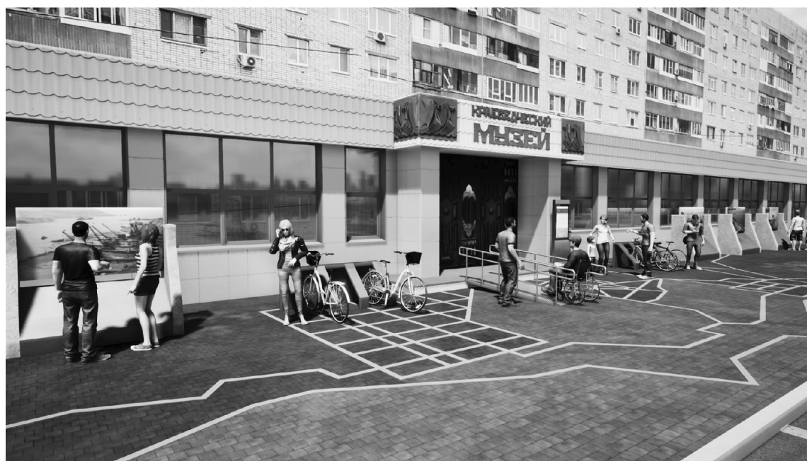
■ Тольяттинский краеведческий музей мечтает о своём бульваре

Цветущий музейный бульвар может появиться в ближайшем будущем вдоль фасада Тольяттинского краеведческого музея. Эскизный проект благоустройства этого пространства разработал центр урбанистики и стратегического развития территорий Тольяттинского госуниверситета (ТГУ). 21 апреля проект был представлен горожанам. Музейный бульвар может стать началом пути по воплощению давней тольяттинской мечты – созданию в городе музейного квартала.