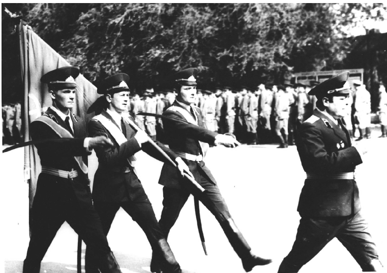
■ Торжественный марш на церемонии принятия присяги, 1980 г.

Более 12 тысяч офицеров прошли за 55 лет подготовку в ВУЦ при ТГУ. Из них 255 — кадровые военные.