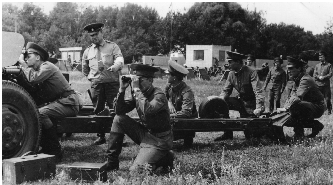
■ Курсанты военной кафедры Тольяттинского политехнического института на учебных сборах, 1980-е гг.

тора ТГУ объединились в одно структурное подразделение университета — институт военного обучения Тольяттинского государственного университета.