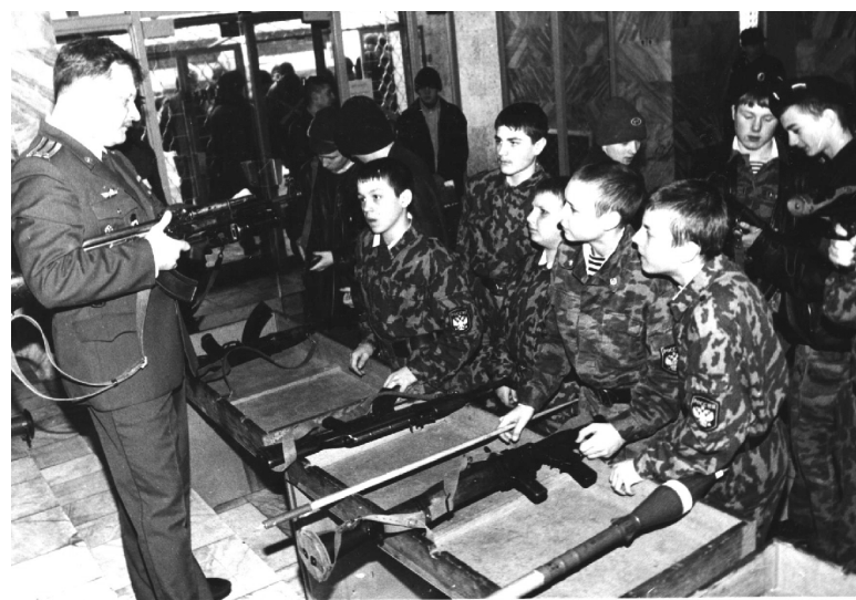
■ Урок мужества для школьников на военной кафедре ТГУ, 2003 г.

не. Причём ТГУ — один из немногих гражданских вузов России, который проводит собственный военный парад. Это масштабное событие, когда торжественным маршем проходят до 700 курсантов