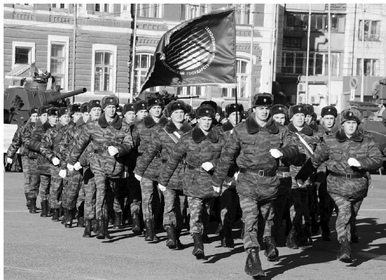
■ Студенты ТГУ – участники Парада Памяти в Самаре, 7 ноября 2015 г.

В 2019 году в условиях оптимизации военной подготовки в российских вузах на федеральном уровне принято решение о преобразовании военных кафедр и учебных военных центров в военные учебные центры с объединением кадрового состава и материальной базы. Так в структуре Тольяттинского государственного университета появился военный учебный центр. Сегодня не каждый российский университет может похвастаться тем, что в его стенах осуществляется как подготовка офицеров для службы по контракту, так и офицеров и сержантов запаса. На данный момент в России действует всего 96 военных учебных центров при вузах (всего в стране более 700 государственных университетов).