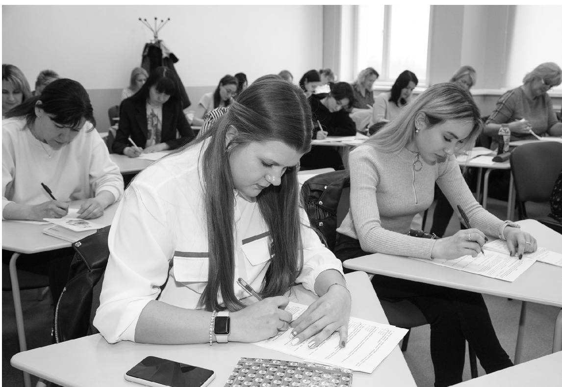
■ В программе повышения квалификации для помощников и секретарей мировых судей ТГУ предусмотрен много практики

П омощники и секретари мировых судей Самарской области прошли повышение квалификации в институте дополнительного образования «Жигулёвская долина» Тольяттинского госуниверситета (ИДО «Жигулёвская долина» ТГУ). За пять дней интенсива слушателям рассказали об актуальных проблемах применения гражданского процессуального законодательства, об особенностях рассмотрения дел об административных правонарушениях, подготовке процессуальных документов, а также дали рекомендации по составлению деловых писем и минимизации использования в них слов-паразитов.