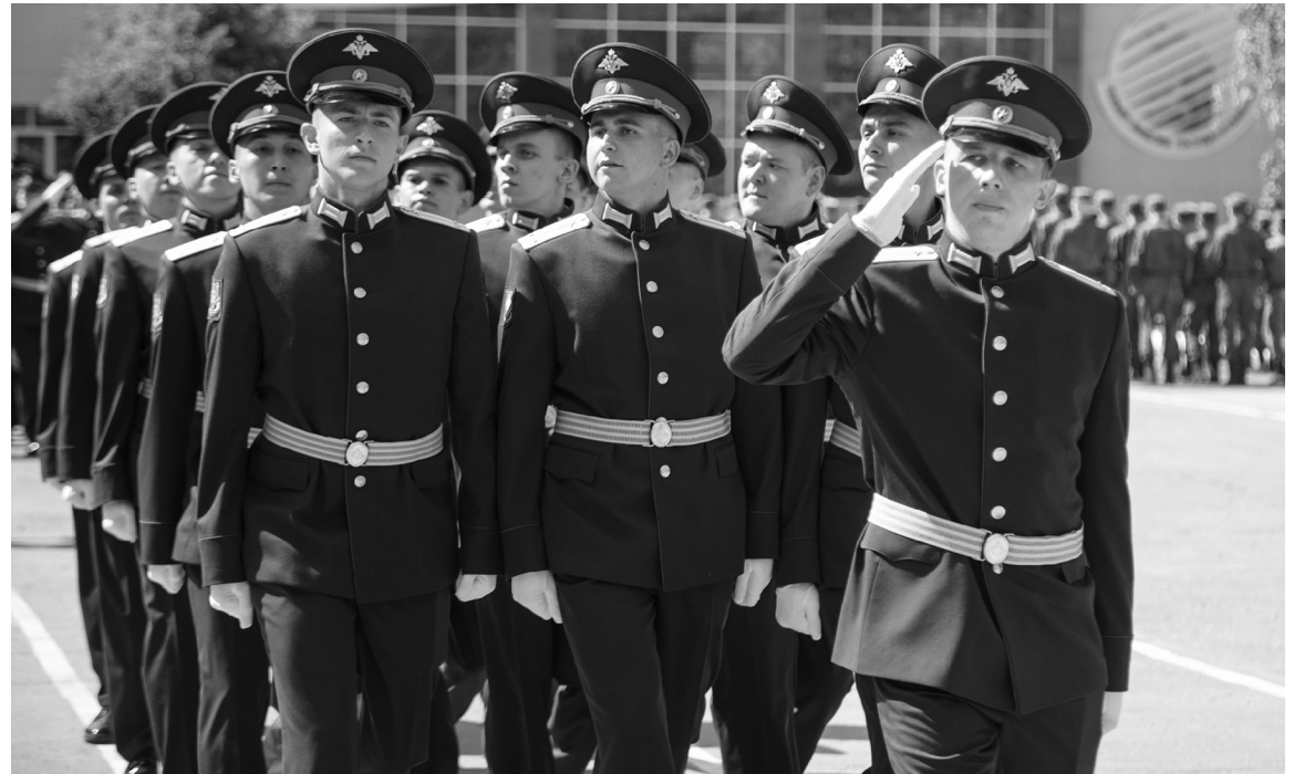
■ Выпускники военного учебного центра ТГУ 2021 года

Военная кафедра ТПИ располагалась в здании по улице Мира, 15. По этому же адресу в 1989 году введён в эксплуатацию новый корпус, позволявший вместить всё необходимое оборудование для обучения студентов, в том числе и артиллерийские орудия. В 1991 году вводятся в строй здания малого артил-