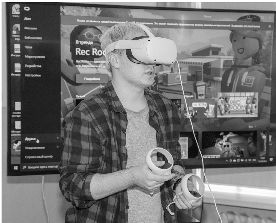
■ VR-технологии открывают большие возможности для обучения школьников

Презентация иммерсивного учебного центра «VR-технологии в мире безопасности» состоялась в Тольяттинском госуниверситете (ТГУ). Учителям школ Самарской области рассказали о том, как сделать виртуальные технологии своими помощниками в обучении детей.