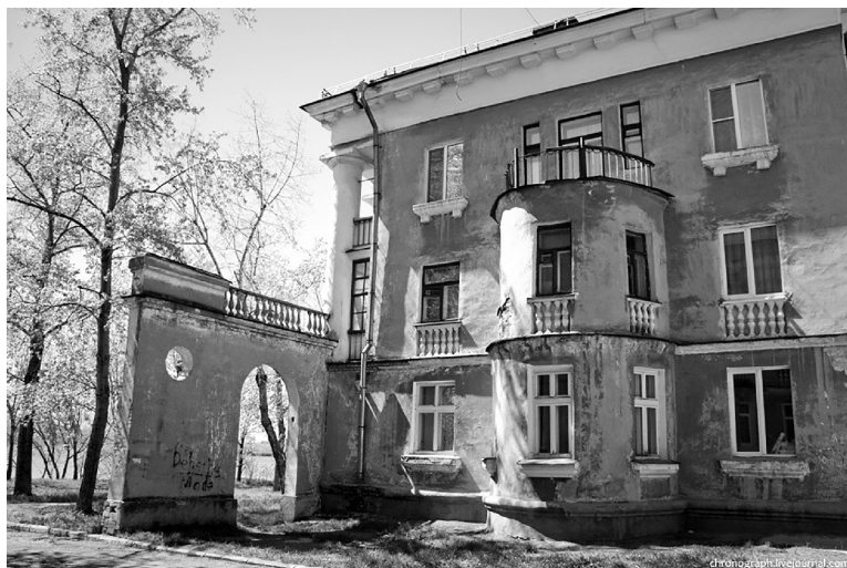
■ Очарование «маленького Петербурга» отразит входная группа в экопарк Шлюзовой, созданная в стиле советского неоклассицизма

Средства гранта будут направлены на формирование в экопарке тематических зон, отсылающих к прошлому района. Предполагается, например, создать локацию, которая перенесёт посетителей в годы рождения микрорайона Шлюзовой, строительства ГЭС и судоремонтного заво-