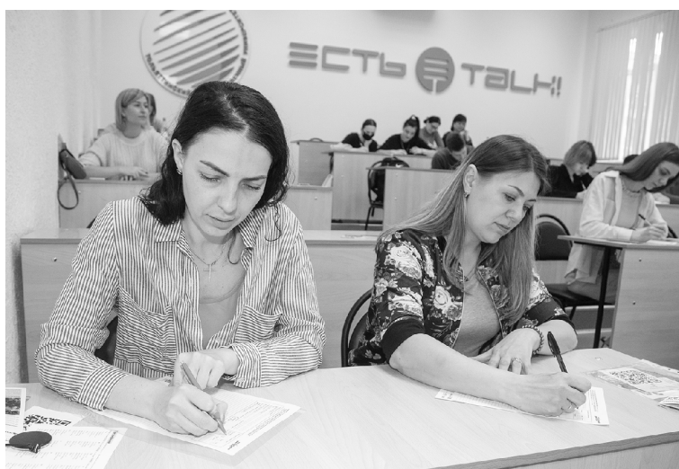
■ Многие участники акции писали «Тотальный диктант» впервые