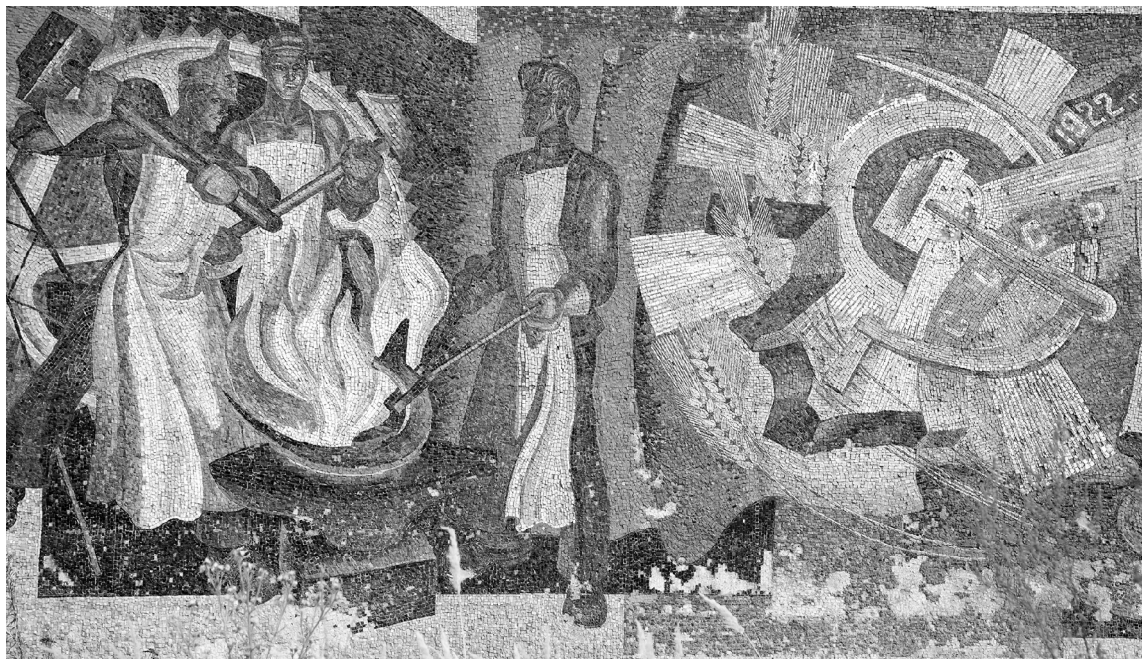
■ В 2022 году на восстановление «золотого бруса» из бюджета Тольятти выделят 15 млн рублей

М озаичная стела «Радость труда» будет отреставрирована до конца 2023 года. Работы по восстановлению монументального панно, разрушающегося и забытого на десятилетия, должны начаться в ближайшие месяцы.