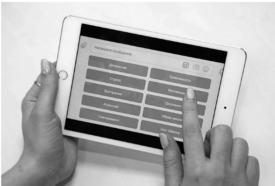
■ Усовершенствованный Doctor Calm поможет врачам и науке

Проект «Психологи – медикам» стал победителем первого в 2022 году конкурса грантов Президента России на развитие гражданского общества. АНО развития инновационных социальных технологий «Лидеры перемен» (Волгоград) будет реализовывать его с помощью чат-бота Doctor Calm – разработки студентов Тольяттинского государственного университета (ТГУ).