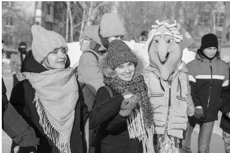
■ Уличные гуляния в Татьянин день – любимая студентами традиция