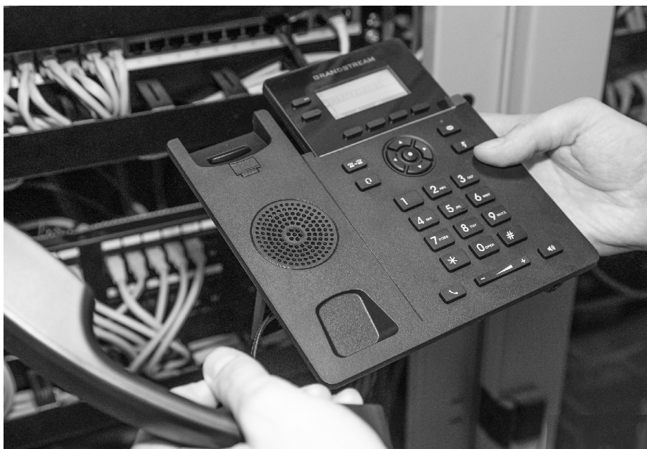
■ С переходом на IP-телефонию в ТГУ произойдёт смена всех телефонных номеров

Т ольяттинский государственный университет (ТГУ) переходит на IP-телефонию. Проект реализуется совместно с Поволжским филиалом ПАО «Мегафон» в рамках программы развития ТГУ, рассчитанной до 2030 года.