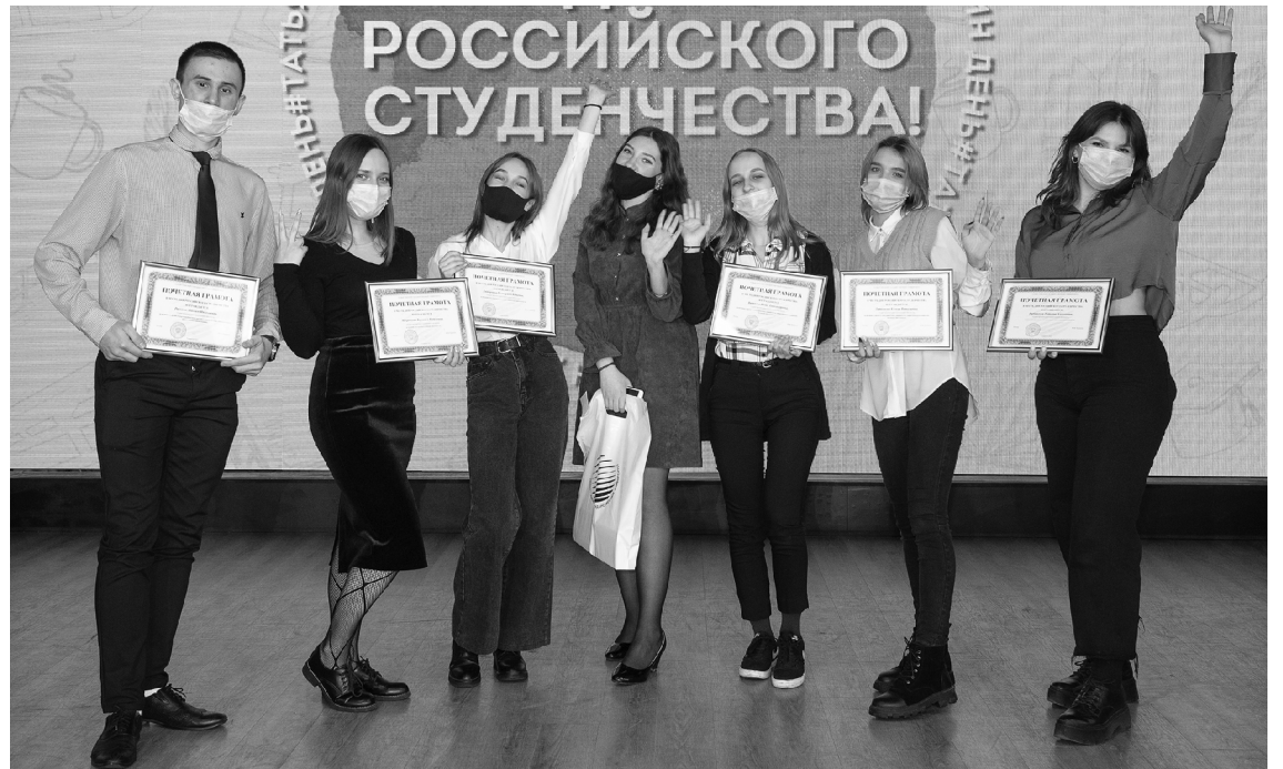
■ На торжественном приёме ректора лучшие студенты Тольяттинского госуниверситета получили внимание, почёт и «умный» подарок

Т ольяттинский государственный университет (ТГУ) отметил День российского студенчества. Торжественный приём ректора в честь лучших студентов и весёлые уличные гуляния, катание с горки и сжигание чучела сессии — всё прошло в лучших праздничных традициях, знаменующих наступление долгожданных зимних каникул.