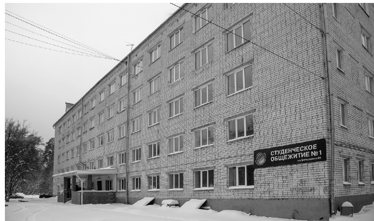
■ В отремонтированном общежитии ТГУ маломобильным студентам будет удобно и безопасно

Создание доступной среды для маломобильных групп на-