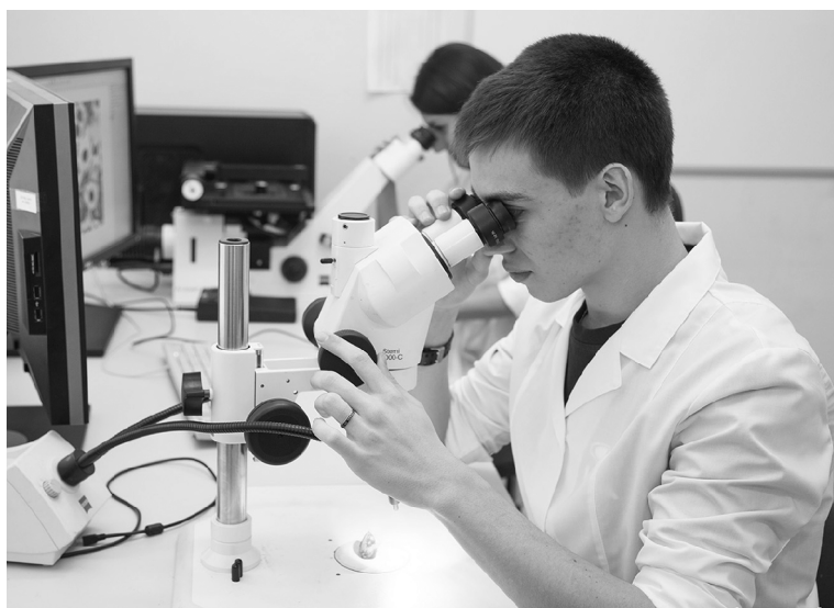
■ В каждом аспиранте живёт дух исследователя и первопроходца

21 января в Тольяттинском государственном университете (ТГУ) отметили День аспиранта. Для многих учёных именно аспирантура стала важным этапом в карьере и временем экспериментов. О своих первых шагах в науку «Тольяттинскому университету» рассказали аспиранты ТГУ.