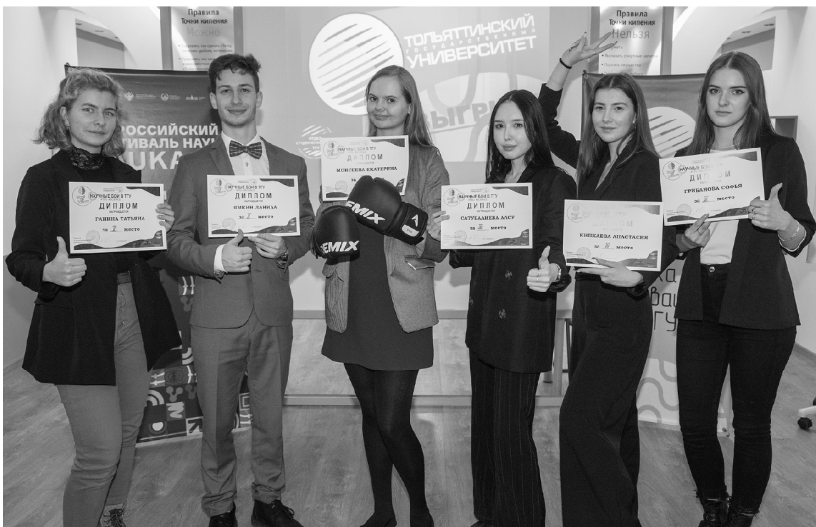
Победители научных боёв Stand-up Science рассказали о науке ярко и увлекательно

В Тольяттинском государственном университете (ТГУ) подвели итоги интеллектуальных боёв. Микросервисная архитектура, фразеологизмы в заголовках СМИ и действия в террористической ситуации — таким темам были посвящены научные стендапы, представленные в финале девятого сезона Stand-up Science.