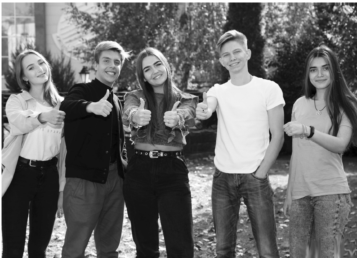
■ Тольяттинский госуниверситет лидирует среди опорных вузов России по итогам реализации своей Программы развития

Т ольяттинский госуниверситет (ТГУ) признан лучшим среди 33 опорных вузов России по результатам оценки деятельности опорных университетов за 2020 год. Об этом сообщил председатель комитета Государственной думы по промышленности и торговле, первый вице-президент Союза машиностроителей России Владимир Гутенёв на расширенном заседании наблюдательного совета Научно-образовательного центра (НОЦ) мирового уровня «Инженерия будущего».