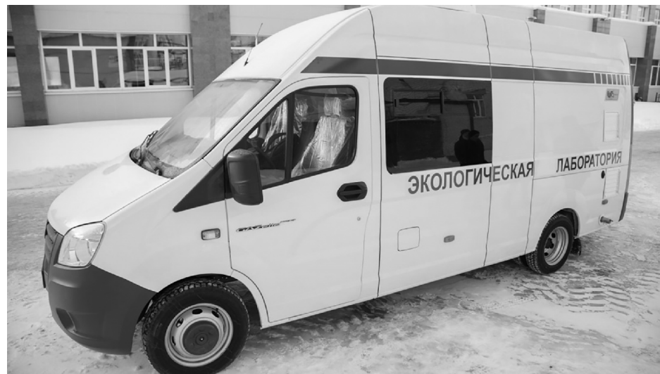
■ Тольяттинская эколаборатория вернулась в родной Саратов для проверки работоспособности своего оборудования