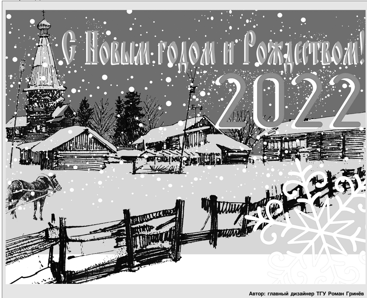
Автор: главный дизайнер ТГУ Роман Гринёв