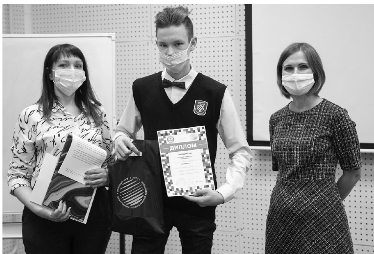
■ Олимпиада по журналистике — первый шаг в будущую профессию

Выполняя задания олимпиады, участникам нужно было перечислить названия местных средств массовой информации, выделить фактическую информацию в видеосюжете по теме особенностей интернет-языка, написать рецензию на книгу, создать мем на тему дистанционного обучения и составить вопросы для интервью с ведущим YouTube-канала. В результате были определены обладатели 12 призовых мест и трёх специальных призов. Также четыре педагога, работающие с юными журналистами, получили благодарственные грамоты. Дипломы и подарки с имидже-