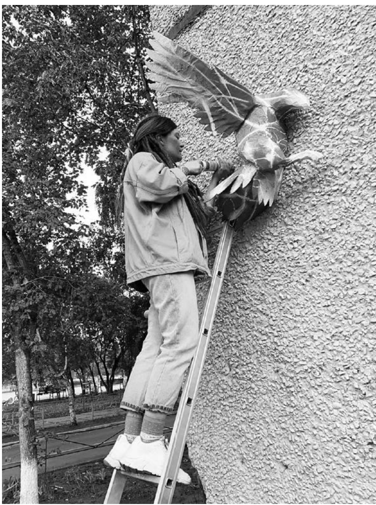
■ Белохвостый орлан радует глаз и призывает к помощи