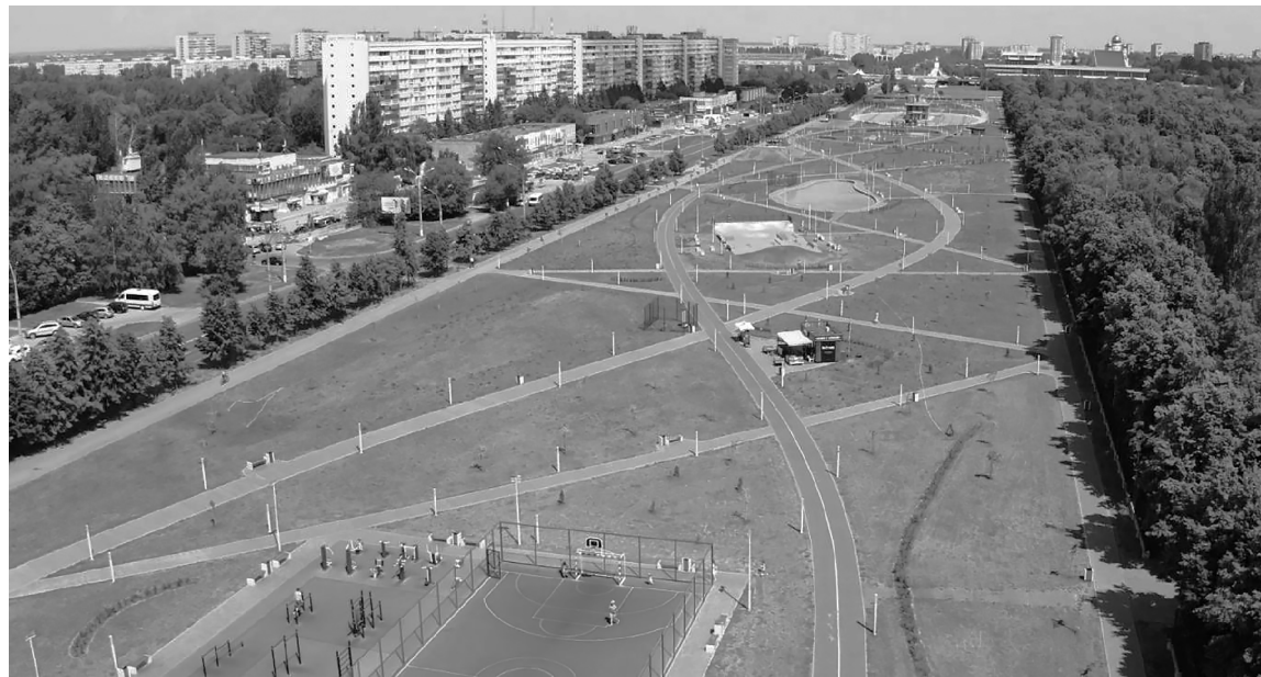
■ Каштаны, липы и клёны посадят волонтеры ТГУ в сквере 50-летия АВТОВАЗа уже в конце октября этого года

Т ольяттинский государственный университет (ТГУ) стал первой организацией в Тольятти, которая решила реализовать проект на принципах инициативного бюджетирования. Идею вуза высадить в сквере 50-летия АВТОВАЗа «Аллею поколений ТГУ» поддержали общественность и администрация города.