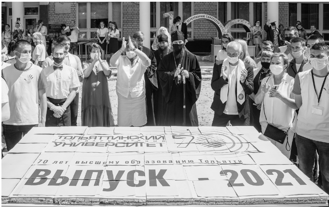
■ Мегабисквит «Гранит науки» испекли в честь выпускников 2021 года на кафедре пищевых технологий ТГУ

Газета «Тольяттинский университет» и молодёжный медиахолдинг «Есть talk!» подводят итоги опроса о самых значимых событиях, которые так или иначе оказали влияние на работу Тольяттинского государственного университета (ТГУ) и его сотрудников в прошедшем 2020/2021 учебном году.