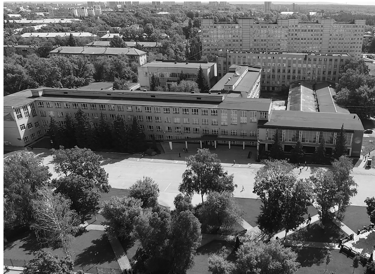
■ Переформат кампуса ТГУ уже запущен

Развитие университетских кампусов вошло в перечень приоритетных направлений развития Тольятти. Инвесторам, которые захотят вложить свои средства в университетский кампус на территории Тольятти, городские власти создадут максимально благоприятные условия, в том числе им предоставят льготы по налогам, поступающим в местный бюджет. Такое решение принято на прошедшем заседании городской Думы.