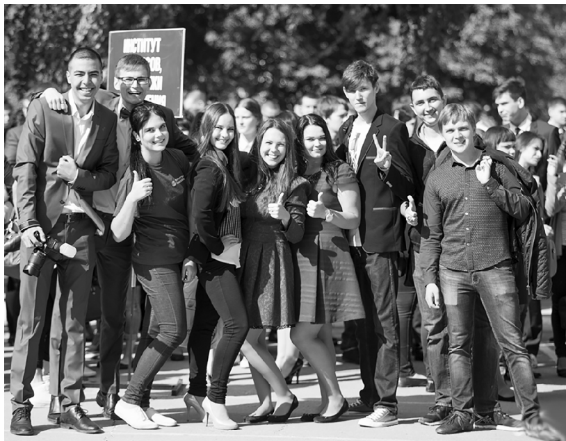
■ К 2030 году в Тольяттинском госуниверситете должно учиться более 30 тысяч студентов, в том числе 10 тысяч очников

Проект строительства высокотехнологичного парка с широким спектром инновационных возможностей тоже будет интегрирован не только в существующую инфраструктуру