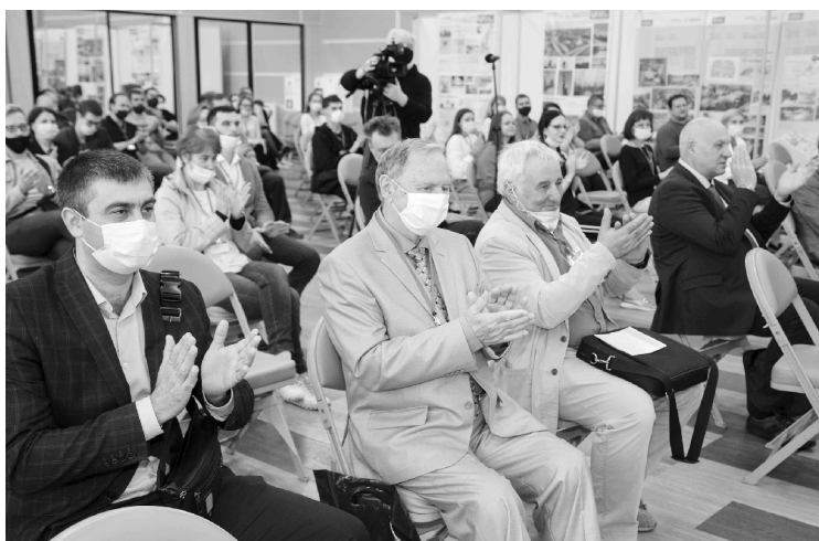
■ На АПП-2021 собралась элита учёных-материаловедов

— Медаль вручается за выдающиеся заслуги в области физического материаловедения и насчитывает порядка 40 лауреатов. Теперь вы,