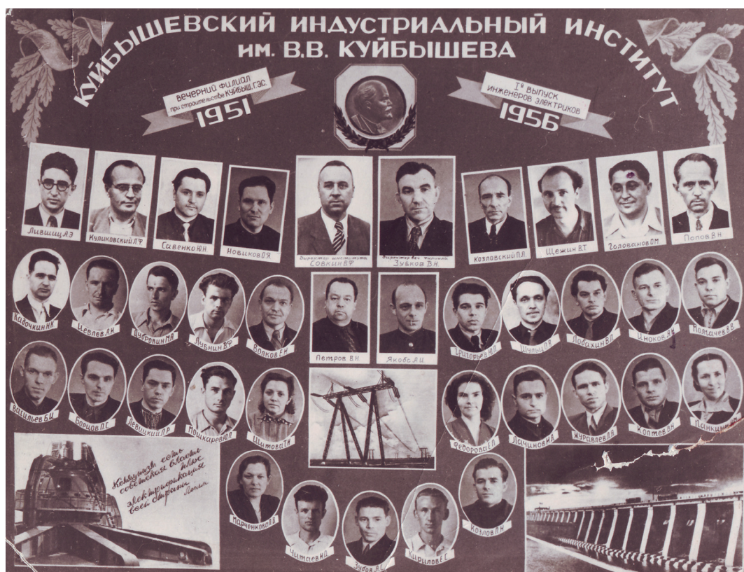
■ Первый выпуск инженеров-электриков Ставропольского вечернего филиала КИИ имени Куйбышева при Куйбышевгидрострое, 1956 год

Т ольятти в этом году отмечает 70-летие высшего образования в городе. В 1951 году был открыт Ставропольский вечерний филиал Куйбышевского индустриального института (КИИ) имени Куйбышева при Куйбышевгидрострое (с 1966 года реорганизован в Тольяттинский политехнический институт). Однако есть и ещё одна памятная дата: ровно 65 лет назад состоялся первый выпуск из первого вуза Ставрополя-Тольятти. В июне 1956 года дипломы о высшем образовании получили инженеры-гидростроители и инженеры-электрики.