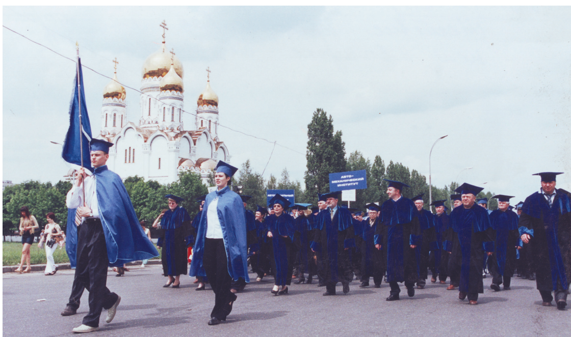
■ Праздничное шествие профессоров и выпускников ТГУ по улице Юбилейной, 2003 год