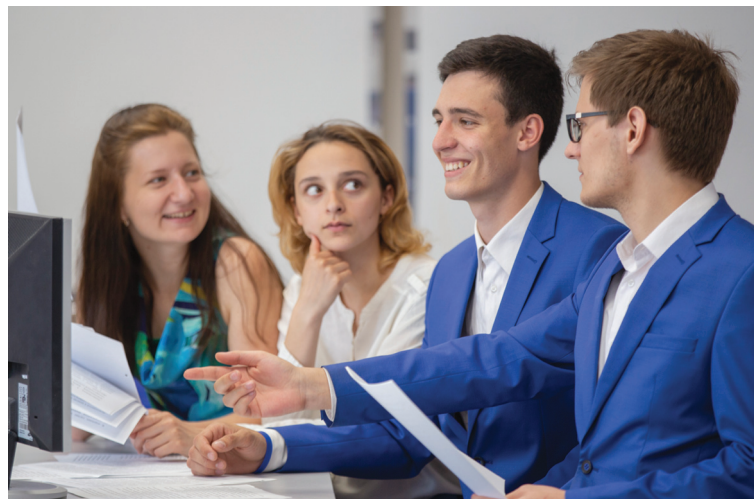
■ 25-30 тысяч рублей могут получать выпускники вузов в компаниях Тольятти на начальном этапе

Объединение детских библиотек Тольятти (МБУК «ОДБ») работает со студентами ТГУ в рамках проектной деятельности. Реализованные проекты касаются не только прямой деятельности библиотек и работы с детьми. Студенты подготовили под запрос