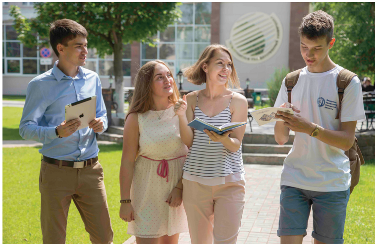
■ ТГУ помогает выпускникам строить карьеру

Большинство вчерашних студентов сталкивается со сложностями при поиске работы по специальности. Молодым специалистам с горящими глазами и высокими амбициями, но зачастую не имеющим опыта работы, непросто выходить на рынок труда. У выпускников Тольяттинского государственного университета в вопросах построения карьеры есть реальная поддержка – Центр трудоустройства ТГУ.