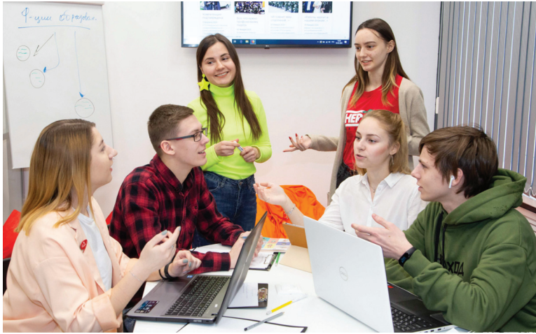
■ Ответственность, дисциплинированность и умение работать в команде важны для соискателей не меньше, чем профессиональные знания

специалисты в области ремонта оборудования, электрогазосварщики.