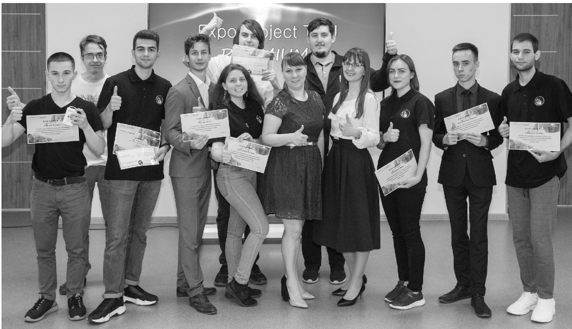
■ 20 из 157 студенческих проектных команд ТГУ получили по результатам EXPO PROJECT TGU финансирование на реализацию своих инициатив

В опорном Тольяттинском государственном университете (ТГУ) подвели итоги EXPO PROJECT TGU: награждены победители, определены студенческие проекты, которые получают гранты на реализацию.