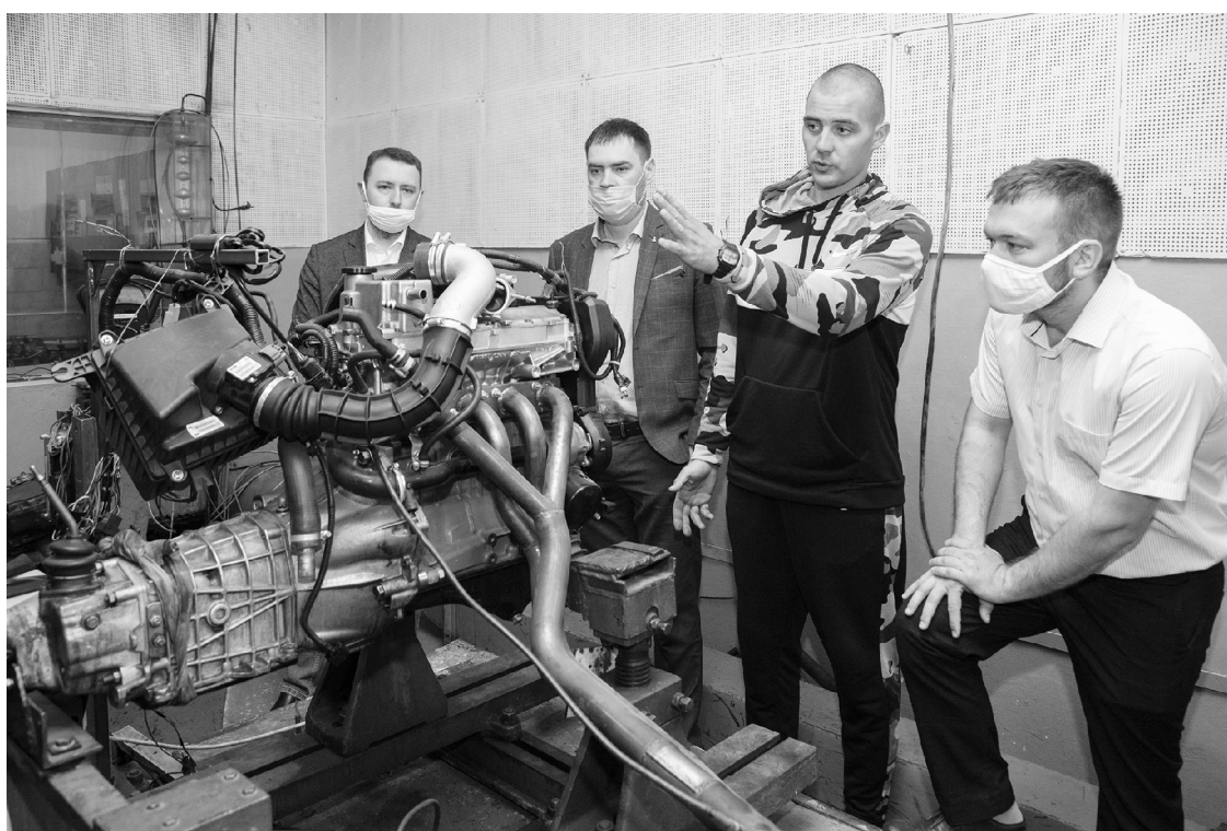
■ Специалисты научно-технического центра КАМАЗа изучили компетенции Тольяттинского государственного университета

Т ольяттинский государственный университет посетила делегация ПАО «КАМАЗ». Представители крупнейшего в России производителя тяжёлых грузовых автомобилей побывали в лабораториях и центрах компетенций опорного вуза и определили направления сотрудничества.