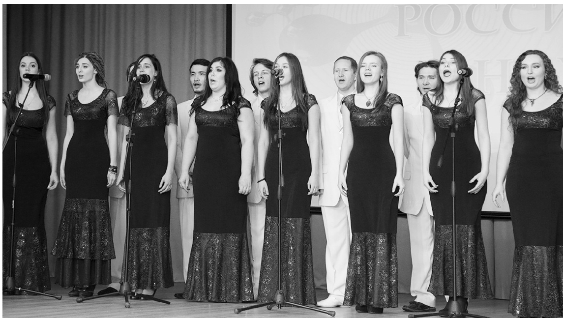
■ Студенческая хоровая капелла ТГУ объявляет набор новых участников