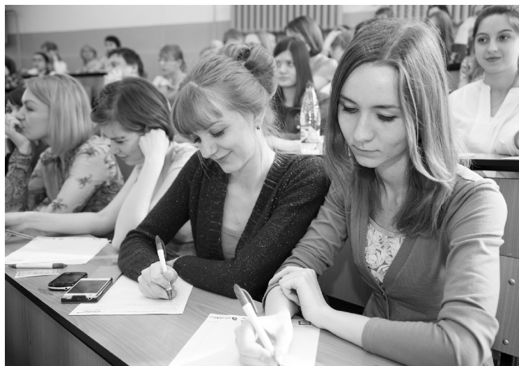
■ Участникам необходимо зарегистрироваться на сайте акции до 9 апреля