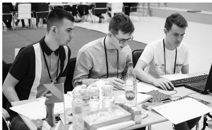
■ Перед программистами ТГУ стояла задача попасть в финал

Россия, Азербайджан, Армения, Белоруссия, Грузия,