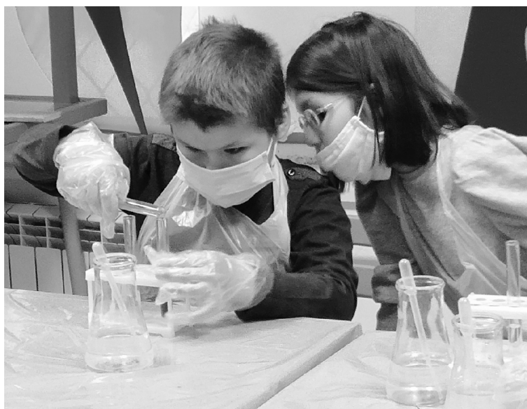
■ Любовь к науке с «Детским университетом»

института дополнительного образования, которые прошли экспертизу и утверждение в Областном межведомственном экспертном совете при министерстве образования Самарской области.