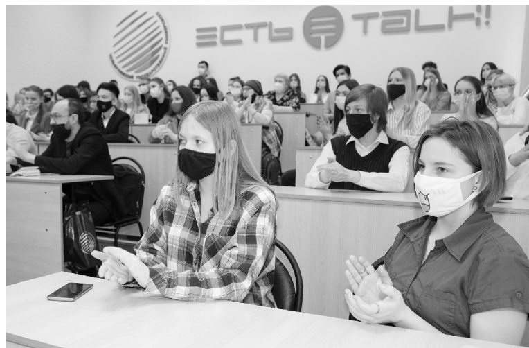
■ Номинация «Требуется решения» – самая популярная в этом году

Обладателем Гран-при конкурса «Тольятти – го-