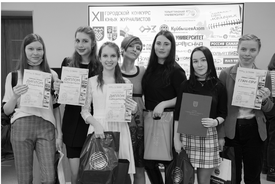
■ Самые перспективные молодые журналисты нашего региона

Т ольяттинский государственный университет (ТГУ) вновь объединил талантливых юных журналистов. 1 апреля в молодёжном медиахолдинге опорного вуза «Есть talk!» состоялось торжественное награждение лауреатов XII ежегодного городского конкурса «Тольятти – город молодых».