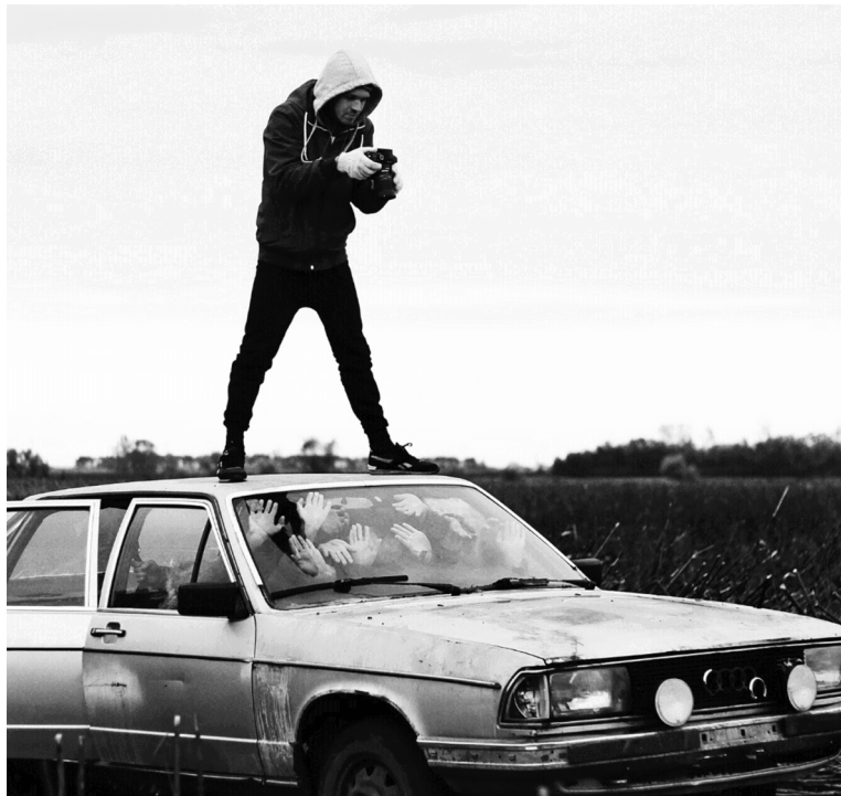
■ Пробы для клипа