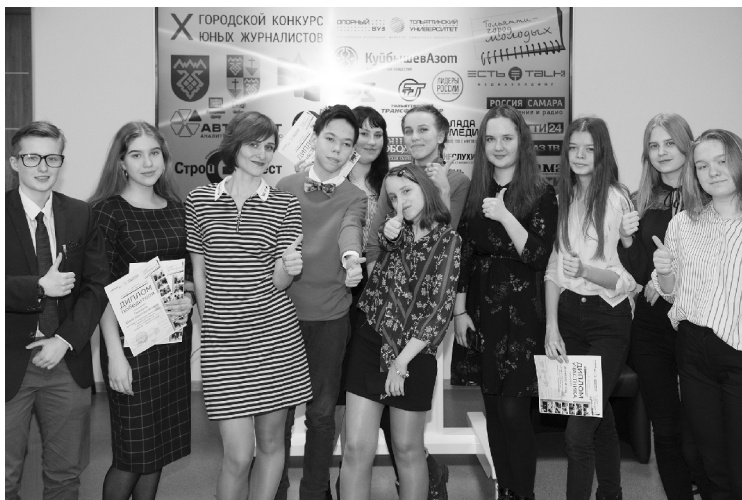
■ На конкурс «Тольятти – город молодых» поступило свыше ста работ

В Тольяттинском государственном университете (ТГУ) 1 апреля в 15.00 состоится торжественное награждение победителей и участников ежегодного городского конкурса юных журналистов «Тольятти – город молодых». На церемонию приглашаются все конкурсанты и их педагоги.