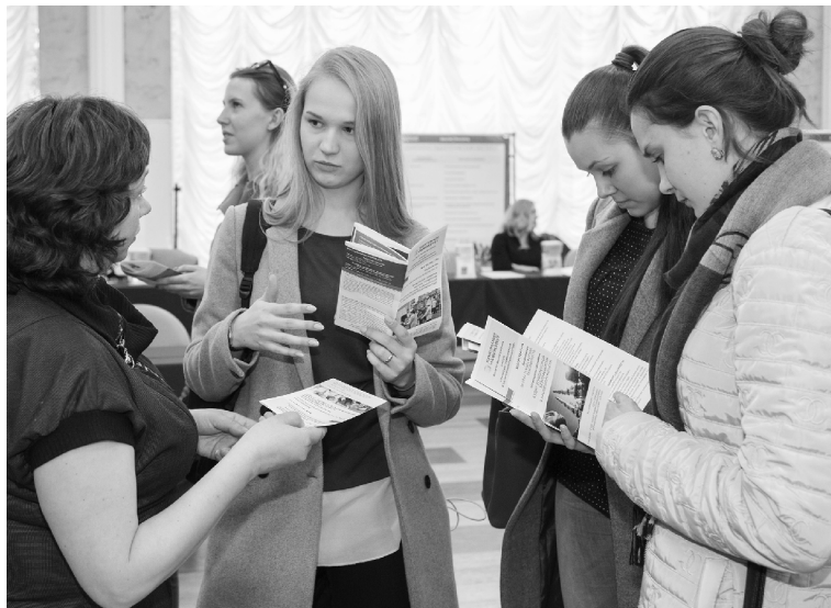
■ ТГУ помогает студентам найти работу