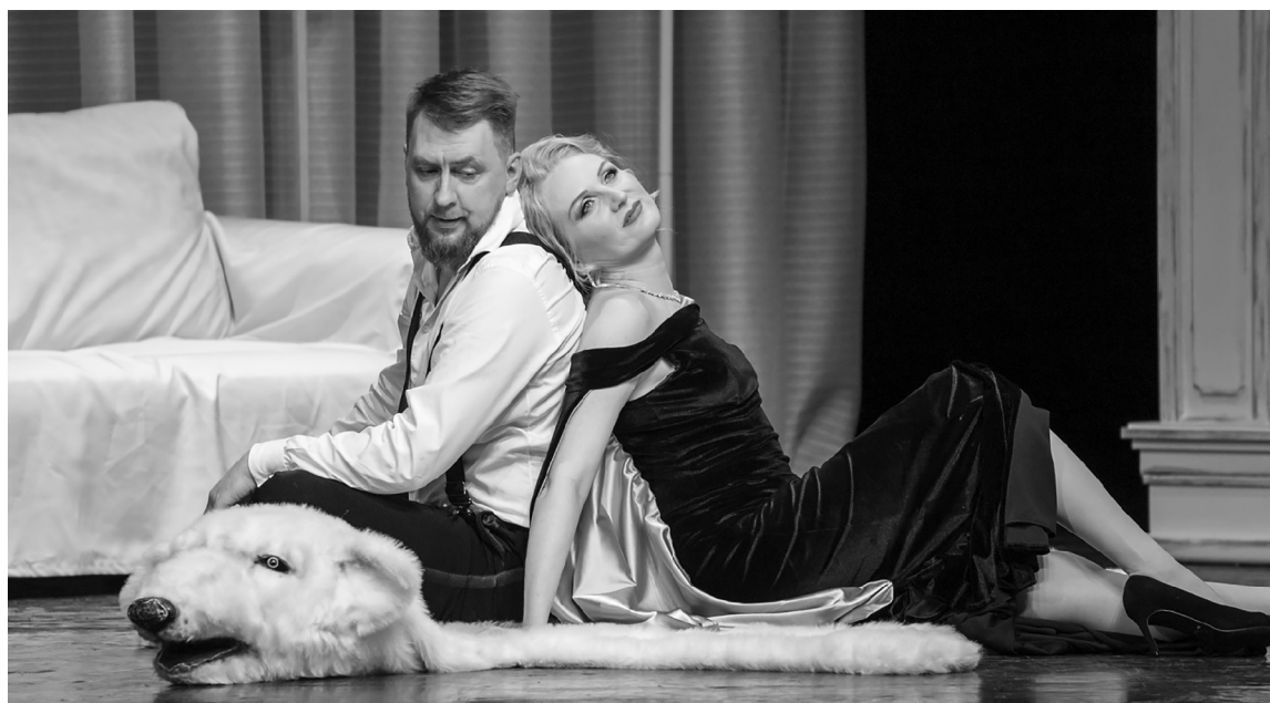
■ Будет ли хеппи-энд у этой истории, решать зрителям