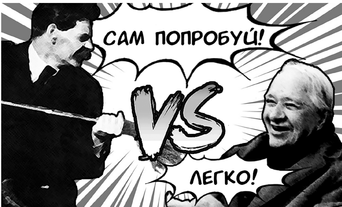
■ Горький «заставил» Чуковского писать для детей.