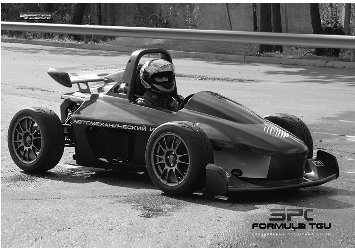
■ Sprint 01: первый болид, собранный студентами ТГУ в 2008 году