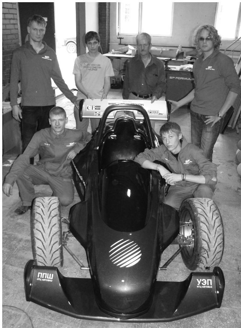
■ Участники команды SPC Formula ТГУ

технический университет. — Прим. Ред.). До того момента ни разу не запускали двигатель, просто установили его на болид. И вот первый раз завели машину, услышали, как она зарычала, тронулась с места и проехала несколько метров на площадке за корпусом института машиностроения. Просто слёзы наворачивались! Когда пилот команды сделал несколько кругов, все ребята были невероятно счастливы. Мы поняли, что способны на многое, если сумели собрать автомобиль, который поехал. — Вы следите за выступлениями команды Тольяттинского госуниверситета Togliatti Racing Team, которая участвует в студенческих инженерно-спортивных соревнованиях «Формула Студент» всероссийского и международного уровня?