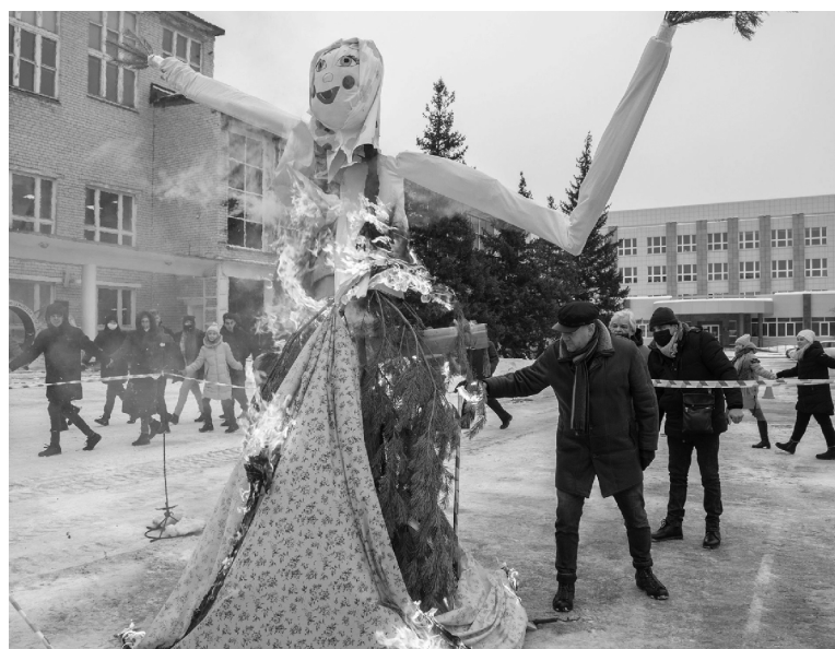
■ ...чучело сжигали