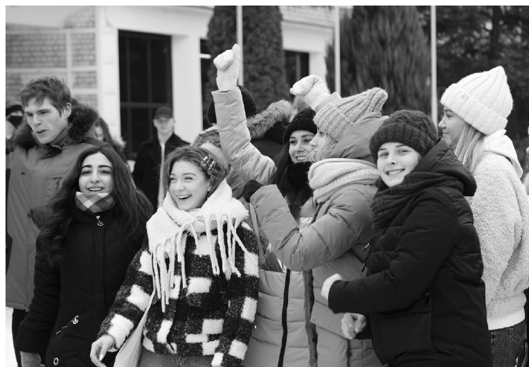
■ ...сессию провожали!