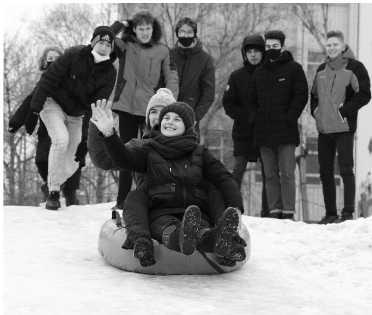
■ С горки катались...

Ежегодно 25 января, в День святой Татьяны – покровительницы студентов – в ТГУ отмечают окончание зимней сессии и чествуют отличившихся студентов. Из-за угрозы распространения коронавируса сейчас в университете отменены все массовые мероприятия, но лишь в очном режиме. Поэтому официальная часть Дня российского студенчества, в том числе и приём ректора ТГУ в честь лучших студентов, были организованы в онлайн.