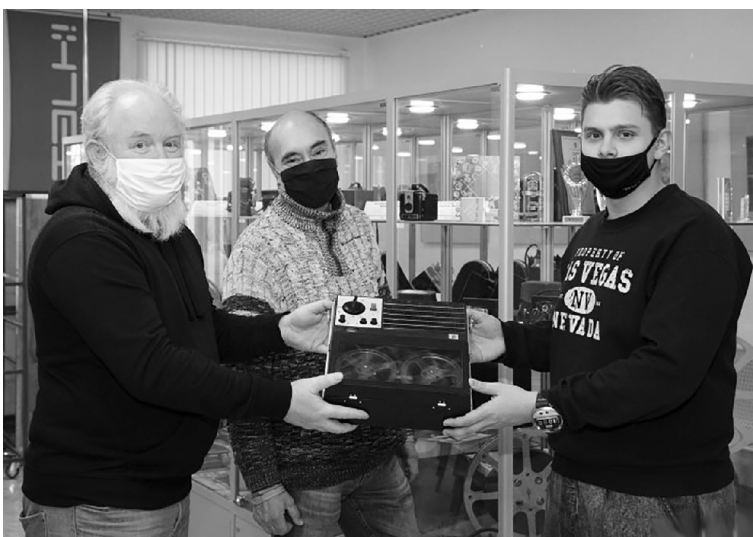
■ Поющий «Романтик» в музее молодёжного медиахолдинга ТГУ

П ервокурсники Тольяттинского государственного университета (ТГУ) реставрируют советскую технику. Первый отреставрированный раритет – катушечный магнитофон «Романтик-304» 1977 года выпуска – бойко звучит и передан в музей молодёжного медиахолдинга ТГУ «Есть talk!».