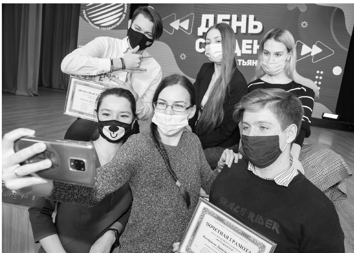
■ ...делали селфи

В опорном Тольяттинском государственном университете (ТГУ) отпраздновали День российского студенчества. Приём ректора ТГУ в честь лучших студентов и встреча студенческого актива с губернатором Самарской области проходили в дистанционном режиме. Праздничные гулянья состоялись на площади перед главным корпусом опорного вуза, а также в виртуальном кампусе ТГУ Minecraft.