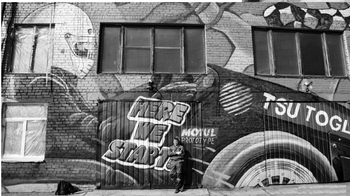
■ Фасад гаража Центра машиностроения ТГУ