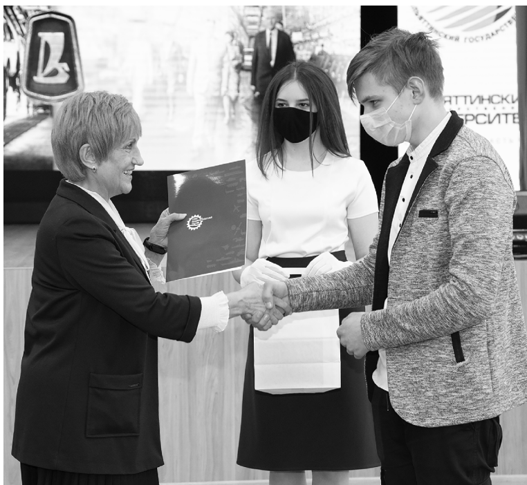
■ Впервые «Поляковские чтения» прошли на базе ТГУ

Б удущие инженеры, конструкторы, учёные сделали свои первые шаги в профессию. В опорном Тольяттинском государственном университете (ТГУ) состоялся региональный конкурс инженерных проектов «Поляковские чтения». В нём приняли участие более 30 школьников и студентов колледжей.