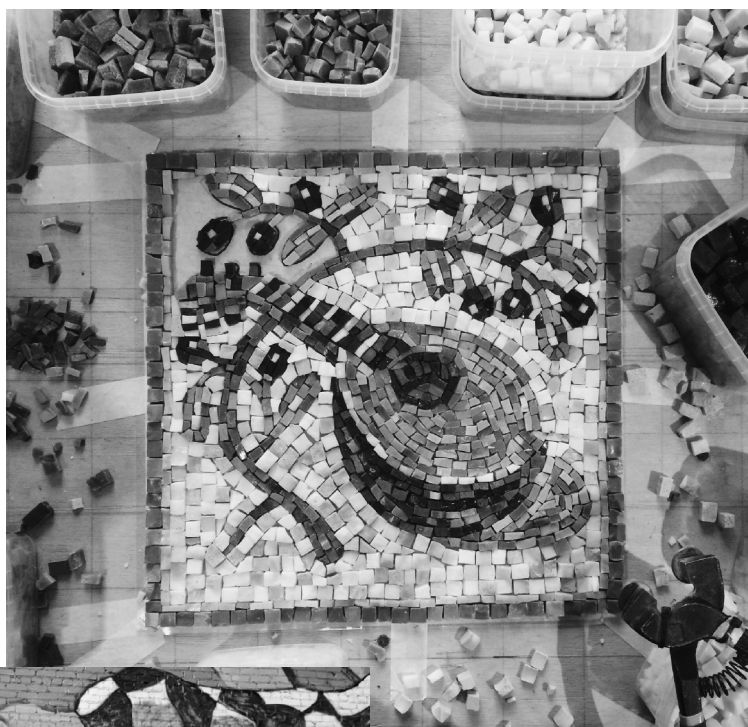
■ Так рождается мозаика...