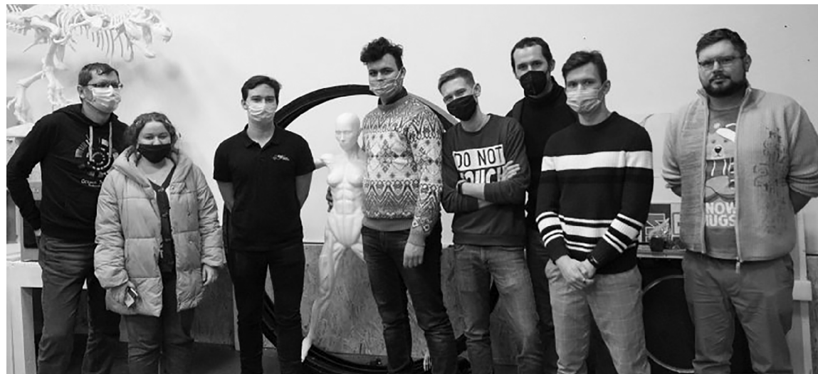
■ Участники Togliatti Racing Team увидели, где и как производят автокомпоненты для проектируемых ими болидов