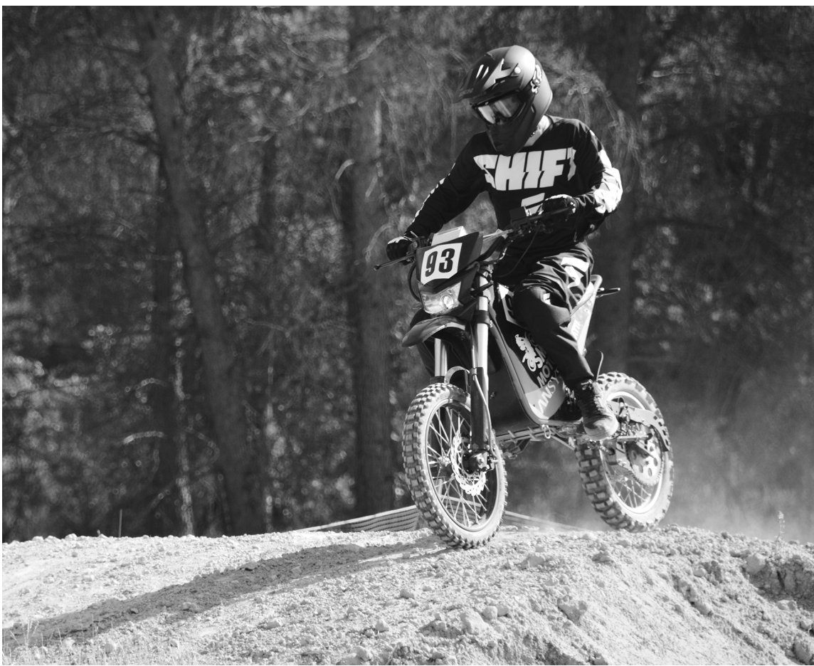
■ Black Panther – самый быстрый в Европе электробайк

О порный Тольяттинский государственный университет (ТГУ) запатентовал электробайк «Black Panther». Федеральная служба по интеллектуальной собственности РФ (Роспатент) приняла решение о выдаче ТГУ патента на промышленный образец.