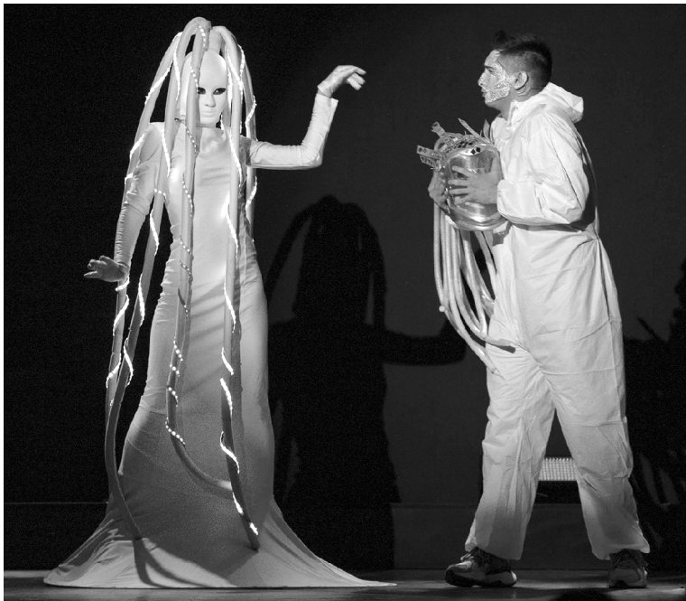
■ Каждый мог сфотографироваться с «космической медузой»

В соцсети «ВКонтакте» с 8 апреля 2021 года Многофункциональный культурный центр ТГУ проводил розыгрыш призов. На гала-концерте «Студенческая весна ТГУ – 2021» были объявлены имена семи победителей. Среди них студенты и сотрудники опорного вуза. Все они получили подарки с корпоративной символикой ТГУ.