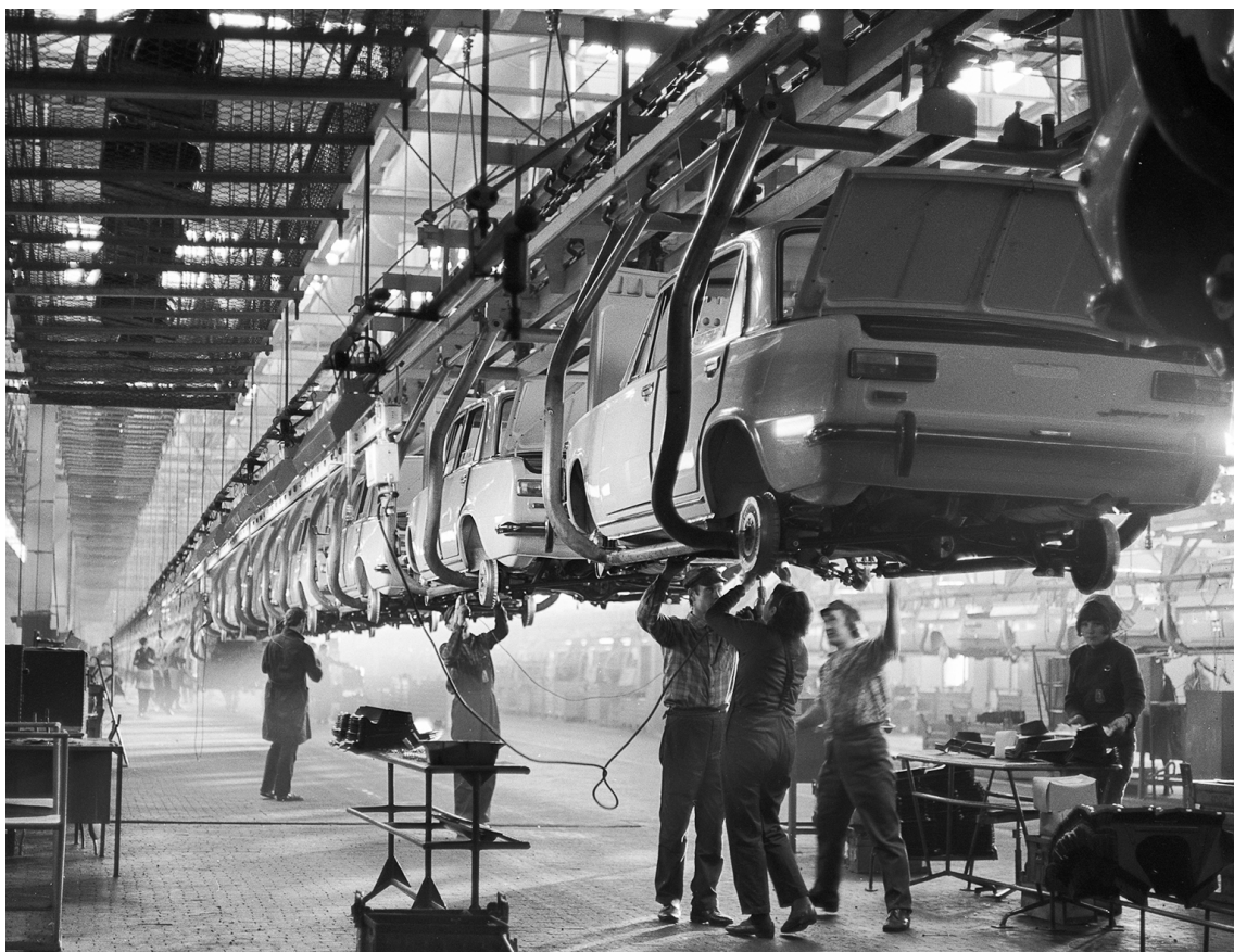
■ Сборка ВАЗ-2101 на главном конвейере Волжского автозавода, 1973 год

Студенты и преподаватели Тольяттинского политехниче-