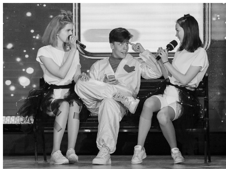
■ В битве за лайки не забудь о настоящей любви