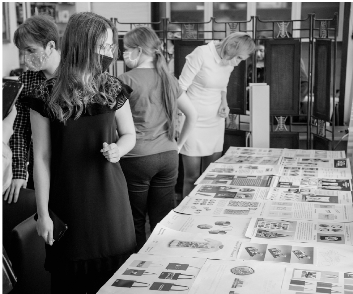
■ У опорного ТГУ появится эксклюзивная «сувенирка»

В Тольяттинском государственном университете (ТГУ) разработали новую сувенирную и рекламную продукцию. Свои идеи, оригинал-макеты и уже готовые изделия предложили студенты – участники первого внутривузовского конкурса на лучшую разработку сувенирной и подарочной продукции с корпоративной символикой.