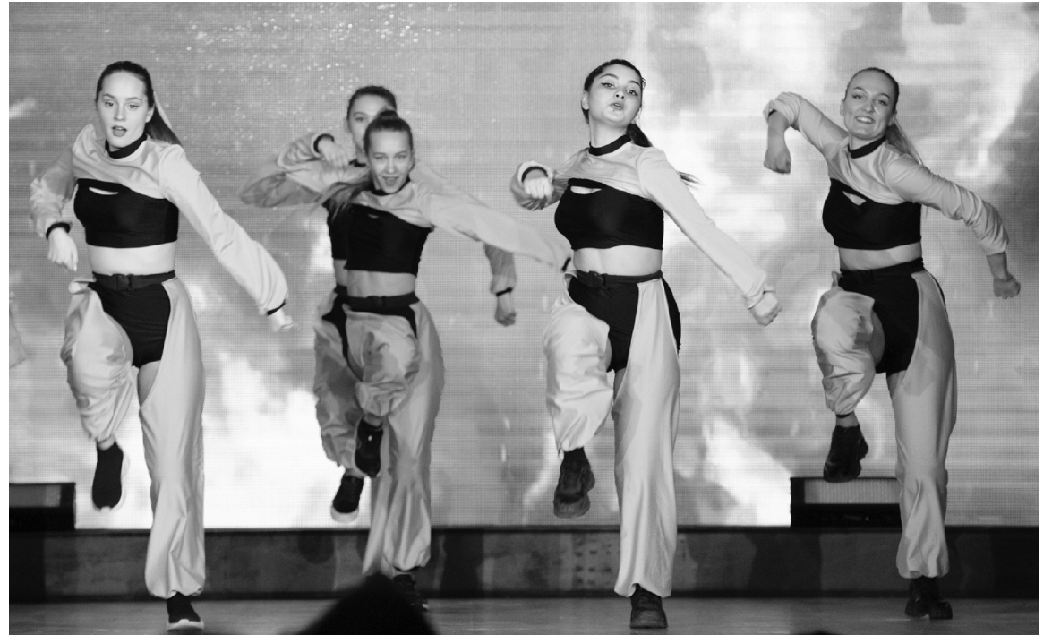
■ Благодаря «Студенческой весне ТГУ – 2021» студенты ТГУ стали ближе к звёздам

В Тольяттинском государственном университете (ТГУ) завершился очередной весенний марафон талантов. На прошлой неделе в актовом зале университета состоялся гала-концерт фестиваля «Студенческая весна ТГУ – 2021» – межгалактическое шоу космовидения «Чувствуй и дыши».