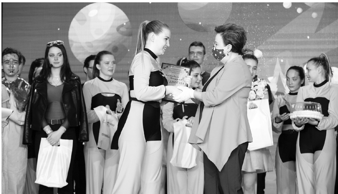
■ Даже в период пандемии «Студвесна ТГУ» не померкла